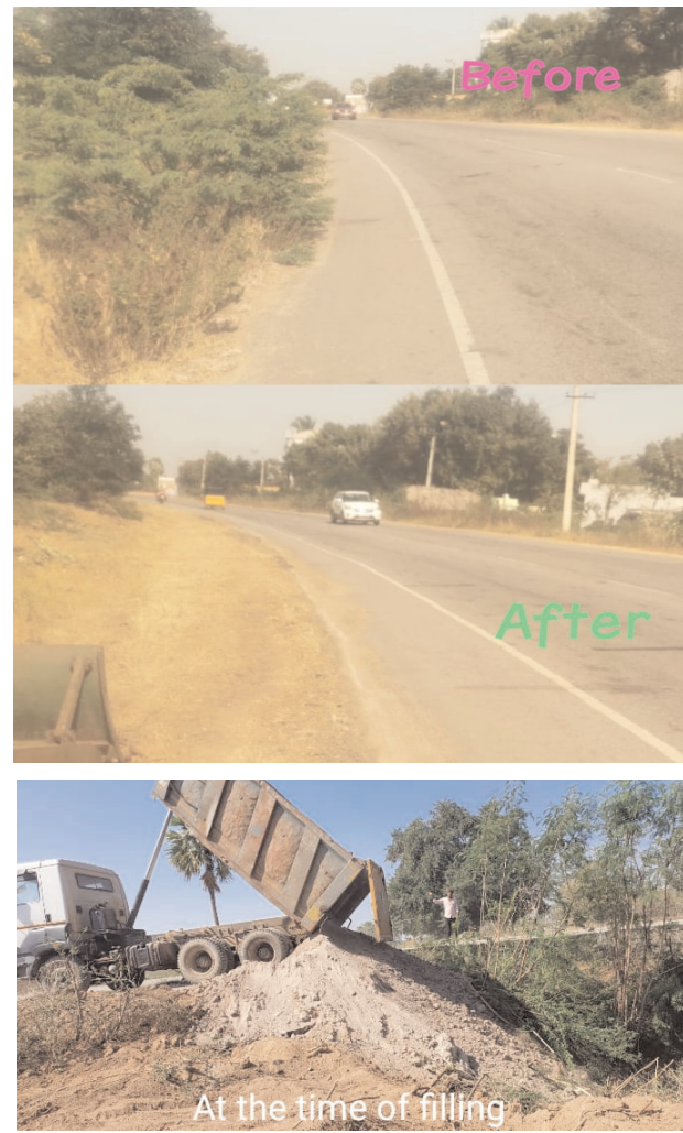
పలకలు ఏర్పాటు చేయడం జరిగిందని ఇంకా ప్రమాదాలు జరుగుతున్న ప్రదేశాలు గుర్తించి నివారణ చర్యలు తీసుకోవడం జరుగుతుందని ఈ సందర్భంగా తెలిపారు.