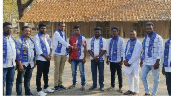
వెంకటాపురం, ఫిబ్రవరి 25