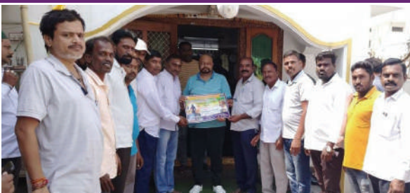
సంగం, ఫిబ్రవరి 25 (ప్రజాజ్యోతి):