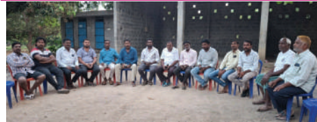
పర్వతగిరి, ఫిబ్రవరి 25 (ప్రజాజ్యోతి)

వరంగల్ జిల్లా పర్వతగిరి మండలం అన్యారం పరిశ్రమ యాకాబ్ షా వలి బాబా దర్గా లో అన్ని వర్గాలకు చెందిన భక్తులు తమ కోరికలు తీర్చాలని ఉద్దేశంతోనే తలనీలాల సమర్పిస్తే భక్తు సమర్పించిన తలనీలాలను దర్గా అధికారులు కొంతమంది దళారులతో కుమ్ముత్తై తలనీలాలను అమ్మిన వారిపై, కొన్న వారిపై, సంబంధిత అధికారులపై చట్ట ప్రకారం కేసులు నమోదు చేసి అరెస్టు చేయాలని, వారి దోపిడీ చేసిన ప్రతి రూపాయిని వాక్స్ బోర్డుకు తిరిగి చెల్లించాలని, మంగళవారం రోజు అన్యారం గ్రామ కాంగ్రెస్ పార్టీ నాయకులు మీడియా సమావేశంలో డిమాండ్ చేశారు. వారు మాట్లాడుతూ తెలంగాణ రాష్ట్రంలో ప్రసిద్ధి పొందిన అన్యారం పరిశ్రమ యాకాబ్ షా వలి దర్గా రాష్ట్రవ్యాప్తంగా కులాలకు మతాలకు అతీతంగా భక్తులు వచ్చి వారి మొక్కుకున్న కోరికలు నెరవేర్చాలనే ఉద్దేశంతో భక్తులు తలనీలాల సమర్పించడంతో భక్తులు సమర్పించిన తలనీలాలను ప్రభుత్వ నిబంధన ప్రకారం బెండర్ వేసి తలనీలాలను వేలంపాట ద్వారా అమ్మవలసిన దర్గా అధికారులు విధులు నిర్వహిస్తూ దళారులతో కుమ్ముత్తై జిల్లా అధికారులకు ఎలాంటి సమాచారం ఇవ్వకుండానే దర్గా అధికారులు దళారులతో కుమ్ముత్తై 60 లక్షల రూపాయలను కాజేసి, ఈ ఆక్రమణకు పాల్పడిన వ్యక్తి కాంగ్రెస్ పార్టీకి చెందిన వాడని పార్టీ పైన బురదజల్లే ప్రయత్నం చేస్తున్నారు. కానీ ఆ వ్యక్తికి కాంగ్రెస్ పార్టీకి ఎలాంటి సంబంధం లేదని అన్యారం పార్టీ నాయకులు తెలియజేశారు.