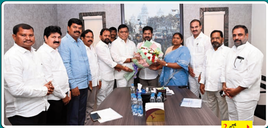
2 లో... >