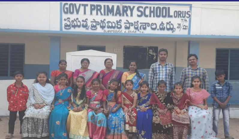
వరంగల్ సీటీ, ఫిబ్రవరి 22 (ప్రజాజ్యోతి):

నగరంలోని ఉర్బు ప్రభుత్వ ప్రాథమిక పాఠశాలలో శనివారం సెల్ఫ్ గవర్నమెంట్ డే కార్యక్రమాన్ని ఘనంగా నిర్వహించారు. పాఠశాలలో 5వ తరగతి చదువుతున్న విద్యార్థిని విద్యార్థులు ఎంతో ఉత్సాహంగా ఉపాధ్యాయులుగా తయారై మిగిలా విద్యార్థులకు పాఠాలు బోధించారు. పాఠశాల షెడ్యూల్ నశిని మాట్లాడుతూ విద్యార్థులు ఉపాధ్యాయులుగా మారి పాఠాలు బోధించడం మిగిలా విద్యార్థులను క్రమశిక్షణలో ఉంచడం ఒక బాధ్యతాయుత భావనలో వారు నిమగ్నమై పనిచేయడం చాలా సంతోషంగా అనిపించింది. నేటి తరం యువత సాఫ్ట్వేర్ రంగాల్లో రాణించాలని ప్రయత్నిస్తున్నారే తప్ప ఉపాధ్యాయ వృత్తిలోకి రావడానికి వెనకడుగు వేస్తున్నారు. నిజానికి నేటి బాలలే రేపటి పౌరులు వారి భవిష్యత్తు తరగతి నాలు