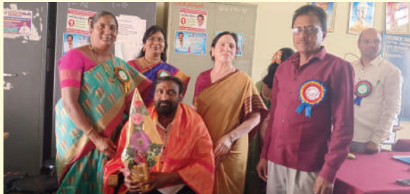
చిట్టాల ఫిబ్రవరి 22 (ప్రజాజ్యోతి):