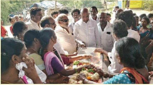
రాయపర్తి, ఫిబ్రవరి 22 (ప్రజాజ్యోతి):