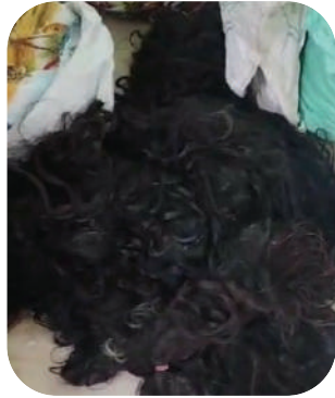
పర్యటగిరి, ఫిబ్రవరి 22 (ప్రజాజ్యోతి):