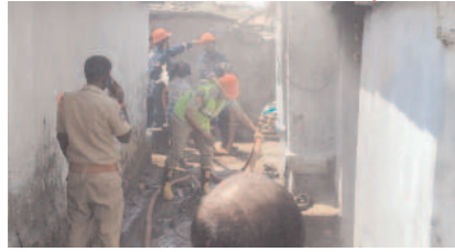
సప్త ముగింపు కార్యక్రమానికి ఇళ్లకు తాళాలు వేసి ఈ కార్యక్రమానికి హాజరయ్యారు. బాధితులకు ప్రభుత్వం ఆదుకోవాలని గ్రామస్థులు కోరుతున్నారు.