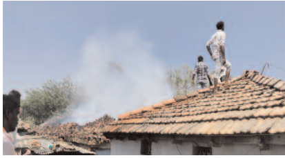
బుడదయ్యాయి. ఇందులో ఐదు సిలిండర్లు ఉండడంతో వాటిని స్థానికులు గమనించి బయటపడవేయడంతో పెద్ద ప్రమాదం తప్పింది. బసవేశ్వర ఆలయం లో కొనసాగుతున్న