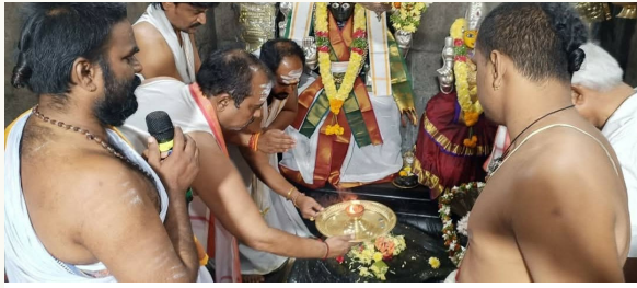
హనుమకొండ జిల్లా ప్రతినిధి : ఫిబ్రవరి 26, ప్రజా జ్యోతి :

మహాశివరాత్రిని పురస్కరించుకొని ఉమ్మడి జిల్లాలలోని ప్రముఖ శైవక్షేత్రాలైన చారిత్రాత్మక వెయ్యి స్థంభముల దేవాలయం, హనుమకొండలోని సిద్ధేశ్వర ఆలయం, మడికొండలో దక్షిణ కాశీగా పేరొందిన మెట్టుగుట్ట శ్రీ మెట్టు రామలింగేశ్వర స్వామి దేవాలయం, పరకాల పట్టణంలోని శ్రీ కుంకుమేశ్వర స్వామి దేవాలయం, ఆత్మకూరు లోని పంచకూట శివాలయం, సంగంలోని సంఘమేశ్వర స్వామి దేవాలయం, కుంటపల్లి రామలింగేశ్వర దేవాలయాన్ని, చింతలపల్లి మరియు కాట్రపెల్లి శివాలయాలను ఈరోజు దర్శించుకొని ప్రత్యేక పూజలు నిర్వహించారు. ఈ సందర్భంగా ఆలయ చైర్మన్, పూజారులు స్వాగతం పలికారు. శివరాత్రి రోజున భక్తి శ్రద్ధలతో శివనామం జపిస్తూ చేపట్టే ఉపవాస ప్రతి ఒక్కరిలో ఆత్మశుద్ధిని, పరివర్తనను కలిగిస్తాయని అన్నారు. ప్రజలు భక్తిశ్రద్ధలతో శివరాత్రి పండుగను జరుపుకోవాలని ఈ సందర్భంగా ఆకాంక్షించారు.