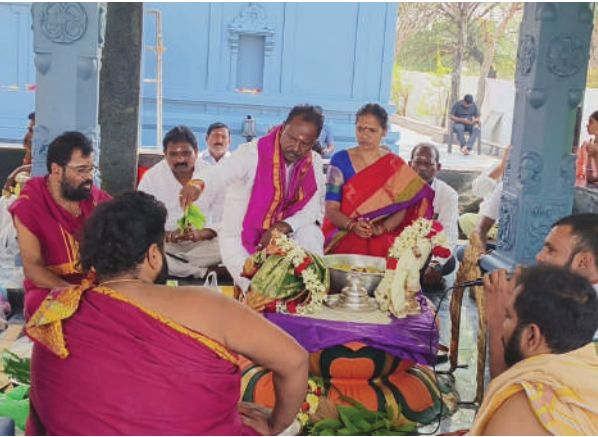
ప్రార్థించారు. అనంతరం భక్తులకు మహా శివరాత్రిని ఎమ్మెల్యే కొద్దిసేపు వడ్డించారు. ఈ కల్యాణ మహోత్సవంలో పెద్ద సంఖ్యలో బుద్ధారం గ్రామస్తులు, చుట్టుపక్కల గ్రామస్తులు పాల్గొన్నారు. 24

ఆలయ ప్రాంగణంలో ఏర్పాటు చేసిన గోశాల, కల్యాణ మండపాన్ని ఎమ్మెల్యే ప్రారంభించారు. అనంతరం ఆలయంలో ప్రత్యేక పూజలు చేసి, శివపార్వతుల కల్యాణ మహోత్సవంలో ఎమ్మెల్యే దంపతులు పాల్గొన్నారు. ఈ సందర్భంగా ఎమ్మెల్యే మాట్లాడుతూ.. శివరాత్రి పర్వదినం రోజున భక్తిశ్రద్ధలతో శివనామం జపిస్తూ, చేపట్టే ఉపవాస దీక్షలు, రాత్రి జాగరణ, పూజలు అభిషేకాలు వంటి ఆధ్యాత్మిక కార్యక్రమాల్లో పాల్గొనాలని ఎమ్మెల్యే సూచించారు. ప్రజలంతా భక్తిశ్రద్ధలతో శివరాత్రి పండుగను జరుపుకోవాలని కోరారు. మహాశివుని కరుణకటాక్షాలు ప్రజలందరిపై ఉండాలని ఎమ్మెల్యే జీవస్పాగ్