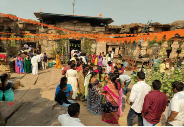
కమిటీ ఆధ్వర్యంలో భారీ ఏర్పాట్లు చేశారు.