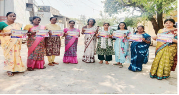
భూపాలపల్లి టౌన్ ఫిబ్రవరి 26 (ప్రజాజ్యోతి):

అంతర్జాతీయ మహిళా దినోత్సవం సందర్భంగా మార్చి 2 తేదీన స్థానిక సింగరేణి హై స్కూల్ కారల్వార్డ్ కాలనీలో జరిగే మహిళల క్రీడా పోటీలను విజయవంతం చేయగలరని సిపిఐ 25వ