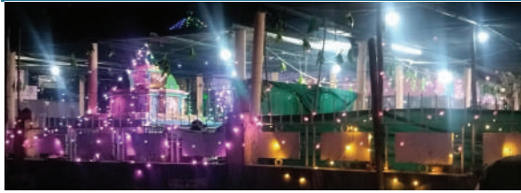
వెంకటాపురం, ఫిబ్రవరి 26 (ప్రజాజ్యోతి):

ములుగు జిల్లా వెంకటాపురం మండల కేంద్రంలో వేంచేసి ఉన్న శ్రీ ఉమా రామలింగేశ్వర స్వామి ఆలయంలో మహాశివరాత్రి పర్వదినాన్ని పురస్కరించుకొని భక్తులు ఉదయం నుంచే స్వామివారికి మొక్కులు చెల్లించారు. నిర్వాహకులు