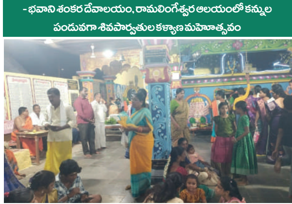
-భవాని శంకర దేవాలయం, రామలింగేశ్వర ఆలయంలో కన్నుల పండువగా శివపార్వతుల కళ్యాణ మహోత్సవం