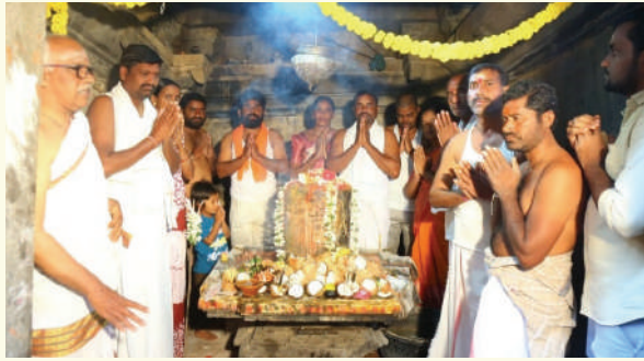
అత్యుత్సాహం, ఫిబ్రవరి 26 (ప్రజాజ్యోతి):