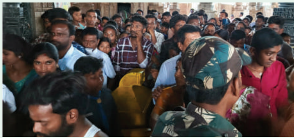
ములుగు జిల్లా స్టాఫ్ రిపోర్టర్ (ప్రజా జ్యోతి):

మహాశివరాత్రి పర్వదినం సందర్భంగా రామప్ప దేవాలయానికి బుధవారం భక్తులు వేలాదిగా తరలి వచ్చారు. రామలింగేశ్వర స్వామి దర్శనం కోసం ఒక్కసారిగా భక్తుల తాకిడి పెరగడంతో ఆలయంలో తోపులాట జరిగింది. చాలా మంది భక్తులు కింద పడ్డారు. చిన్న పిల్లలు, వృద్ధులు తీవ్రంగా ఇబ్బంది పడ్డారు. మహాశివరాత్రి రోజు 50 వేలకు పైగా భక్తులు వస్తారని అంచనా వేసిన అధికారులు.. భక్తులను అదుపు చేసేందుకు తగ్గట్టుగా పోలీస్ సిబ్బందిని ఏర్పాటు చేయలేదని పలువురు ఆగ్రహం వ్యక్తం చేశారు. అక్కడ ఉన్న దేవాలయాలు శాఖ సిబ్బంది భక్తులను అదుపు చేసేందుకు ప్రయత్నించినా వారి ప్రయత్నం విఫలమైంది. ఇద్దరు, ముగ్గురు మహిళా పోలీసులు కనిపించినా భక్తులను అదుపు చేయలేక పోయారు. పైఅధికారులకు ఫోన్ లో పదేపదే సమాచారం ఇచ్చినా పట్టించుకున్నట్లు కనిపించలేదు. దీంతో రామప్ప దేవాలయంలో కిటికీల దుతున్న భక్తులు ఆగమాగమయ్యారు. మహాశివరాత్రికి ముందు ఏర్పాట్లు ఘనంగా చేస్తామని చెప్పుకున్న అధికారులు సమయానికి చేతులెత్తేయడంతో భక్తులు పరిస్థితి ఇబ్బందికరంగా పరిణమించింది. ఇప్పటికైనా రామప్ప దేవాలయంలో దర్శనాలు తోపులాటలు లేకుండా ప్రశాంతంగా దైవదర్శనం జరిగేలా అధికారులు చర్యలు తీసుకోవాలని భక్తులు కోరారు. 7