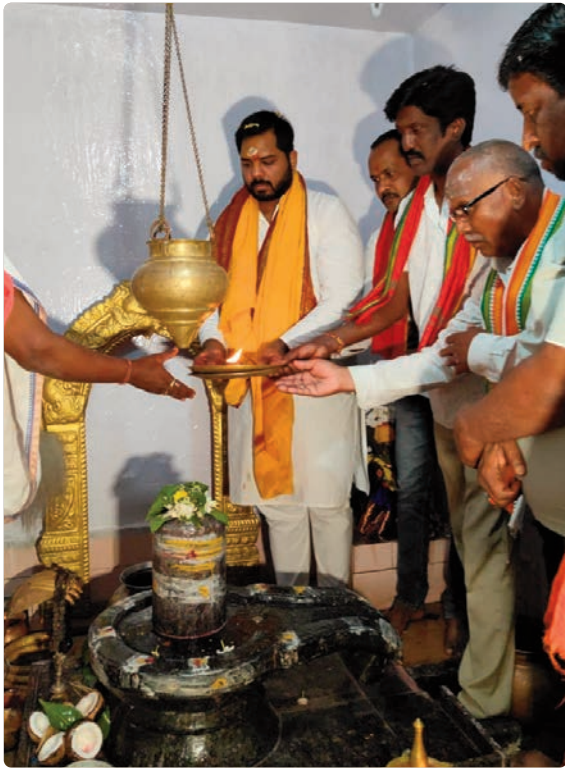
పెద్దపల్లి ప్రతినిధి, (ప్రజా జ్యోతి), ఫిబ్రవరి 26: మహాశివరాత్రి వేడుకలు ఉమ్మడి కరీంనగర్ జిల్లాలో అత్యంత ఘనంగా జరి