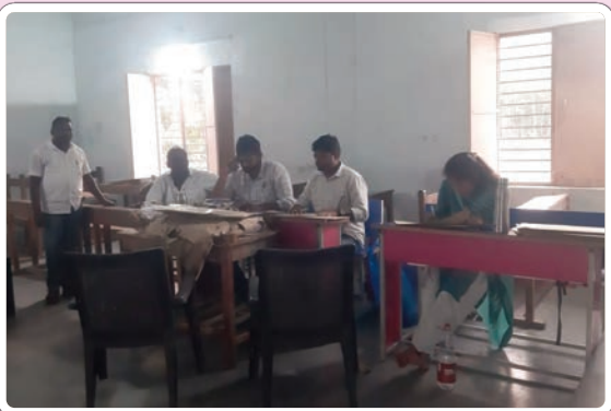
కొడిమ్యాల, ఫిబ్రవరి 26, (ప్రజాజ్యోతి):

కరీంనగర్, ఆదిలాబాద్, నిజామాబాద్, మెదక్ గ్రాడ్యుయేట్, టీచర్స్ ఎమ్మెల్సీ ఎన్నికల నిర్వహణకు కొడిమ్యాల మండలంలో ఏర్పాటు పూర్తయ్యాయి. మండలంలో మొత్తం 2122 గ్రాడ్యుయేట్ ఓటర్లు ఉండగా, టీచర్ ఓటర్లు 35 మంది ఉన్నారు. వారు ఓటు హక్కు వినియోగించుకునేందుకు 3 పోలింగ్ కేంద్రాలు ఏర్పాటు చేశారు. పోలింగ్ కేంద్రంలో 9 మంది సిబ్బంది విధులు నిర్వహించనున్నారు.