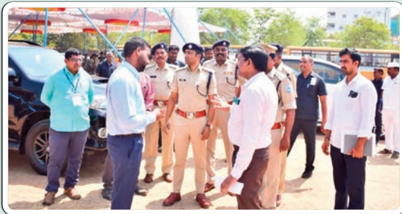
జగిత్యాల, క్రైమ్ ఫిబ్రవరి 26, ప్రజా జ్యోతి: