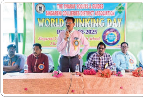
ఇల్లందు, ఫిబ్రవరి 22, ప్రజాజ్యోతి: