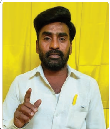
ఇల్లందు, ఫిబ్రవరి 22, ప్రజాజ్యోతి:

తిరగోచ్చని, తెలంగాణ గడ్డపై పుట్టిన తెలుగుదేశం పార్టీని, చంద్రబాబు నాయుడును విమర్శించడం మానుకోవాలని హితవు పలికారు. 2009లో చంద్రబాబు నాయుడు దయతోనే కేసీఆర్, హరీష్ రావు, కేటీఆర్ గెలిచారన్న విషయాన్ని గుర్తుంచుకోవాలన్నారు. అనాడు తెలుగుదేశం పార్టీ పొత్తు లేకుండా వాళ్ళు గెలిచేవారా అని ప్రశ్నించారు. అనాడు చంద్రబాబు నాయుడు తెలంగాణ ప్రాంతంలో చేసిన అభివృద్ధి ఆయన దూర దృష్టిని ప్రజలకు వివరిస్తూ మీరు ఓట్లు అడగలేదని గుర్తు చేశారు. మరల సింటిమెంట్ రగిలించి లబ్ధి పొందాలని చూస్తున్నారని, తెలుగుదేశం ప్రభుత్వ హయాంలో బదులు బలహీన వర్గాలకు ఎంత మేలు జరిగిందో ఏ గ్రామానికి వెళ్ళిన ప్రజలు చెబుతారన్నారు. మాజీ ముఖ్యమంత్రి కేసీఆర్ రాజకీయ కుట్రపూరిత విద్యేషాలతో మాట్లాడడం మానేయాలని అలా మాట్లాడితే తెలుగుదేశం పార్టీ కార్యకర్తలు చూస్తూ ఊరుకోరని హెచ్చరించారు.