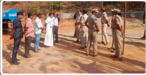
బెల్లంపల్లి, ఫిబ్రవరి 22(ప్రజాజ్యోతి)