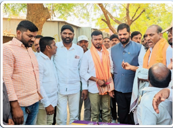
బెల్లంపల్లి, ఫిబ్రవరి 22(ప్రజాజ్యోతి)

బెల్లంపల్లి పట్టణంలోని 31వ వార్డు కాంగ్రెస్ పార్టీ నాయకులు లెంకల సన్నియాదవ్ పుట్టినరోజు సందర్భంగా కాంగ్రెస్ పార్టీ నాయకులు సమక్షంలో కేకు కట్ చేసి శుభాకాంక్షలు తెలియచేసిన పెద్దపల్లి ఎంపీ గడ్డం వంశీ