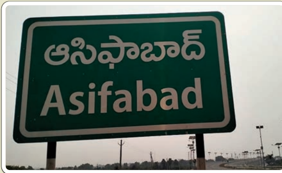
కొమరం భీం జిల్లా ప్రతినిధి ఫిబ్రవరి 22 ప్రజా జ్యోతి

కొమరం భీం జిల్లా కేంద్రంలో గల గురుకుల పాఠశాల విద్యార్థులకు అనుమతులు లేని ఐస్ క్రీమ్ లా విక్రయాలతో అనారోగ్య సమస్యలు ఇందుకు సంబంధించిన అధికారుల పట్టించుకోకపోవడంతో పొంచి ఉన్న ప్రమాదం అనుమతులు లేని ఐస్ క్రీమ్ విక్రయాలపై చర్యలు చేపట్టి హాస్టల్ ప్రాంగణాల్లో ఐస్ క్రీమ్ లు అమ్మకాలు జరగకుండా చూడాలి అవసరం ఎంతైనా ఉంది విద్యార్థులకు విద్యాబుద్ధులు నేర్పాలి అని విద్యాలయాల్లో అనుమతులు లేని ఐస్ క్రీమ్ పిల్లలు వాటిని కొనుగోలు చేయకుండా ఉపాధ్యాయులు చూడాలి అవసరం ఎంతైనా ఉంది జిల్లాలో గల కొన్ని గురుకులాల్లో ఉపాధ్యాయుల తీరే వేరు విధి నిర్లక్ష్యంతో విద్యా బోధన అండక విద్యార్థులు నష్టపోతున్న వైనం ఉపాధ్యాయులు హాస్టల్ విద్యార్థులకు విద్యాబోధన అందించకుండా వారి వ్యక్తిగత సెలవులపై వెళ్ళూ ఉన్నతాధికారులకు ముదుపులు చెల్లిస్తున్నారన్న ఆరోపణలు ఇట్టి ఉపాధ్యాయులపై చర్యలు చేపడుతూ వీరికి వ్యక్తిగత సెలవులపై వెళ్ళినా కూడా ఉపాధ్యాయుల హాజరు పట్టికలో మాత్రం హాజరు వేస్తూ నెలవారి జీతభత్యాలలో కొంత పై అధికారులకు అందిస్తున్నారన్న ఆరోపణలు వెల్లువెత్తిన వైనం ఇట్టి ఉపాధ్యాయులపై తక్షణమే చర్యలు చేపట్టి సకాలంలో విద్యార్థులకు విద్యా అందే విధంగా చూడాలి అవసరం ఎంతైనా ఉంది.