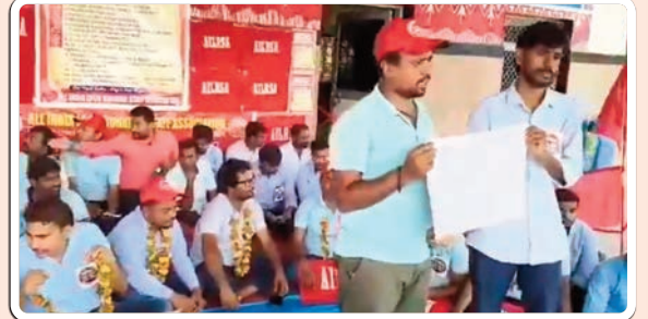
బెల్లంపల్లి, ఫిబ్రవరి 21(ప్రజాజ్యోతి)

రైల్వేలో విధులు నిర్వహిస్తున్న లోకో ఫైలట్ల సమస్యలను పరిష్కరించాలని డిమాండ్ చేస్తూ బెల్లంపల్లి రైల్వేస్ లోకో ఫైలట్ల చేస్తున్న నిరసన డిక్ష శుక్రవారం రెండవ రోజుకు చేరుకుంది. ఈ సందర్భంగా లోకో ఫైలట్ల సంఘం నాయకులు పట్టే, వివేకులు మాట్లాడుతూ రైల్వేలోని అన్ని విభాగాలకు అమలు చేస్తున్న రన్నింగ్ అలవెన్స్ 25 శాతాన్ని రన్నింగ్ స్టాప్ కు ఇవ్వాలని కోరారు. బదిలీల ప్రక్రియ వేగవంతంగా నిర్వహించాలని డిమాండ్ చేశారు