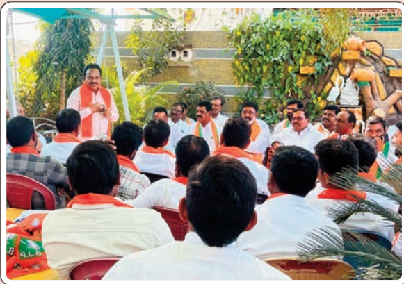
ఆదిలాబాద్ బ్యారో ఫిబ్రవరి 21, (ప్రజా జ్యోతి)

ఎమ్మెల్యే పవార్ రామారావు తో కలసి ఎంపీ గోడం నగేష్ విస్తృత ప్రచారం