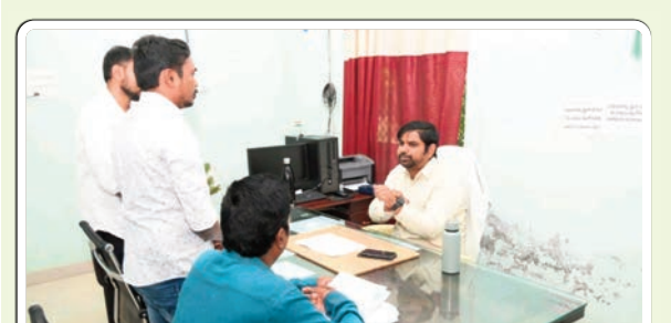
బెల్లంపల్లి, ఫిబ్రవరి 21(ప్రజాజ్యోతి)