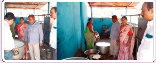
జన్నారం ఫిబ్రవరి 21(ప్రజా జ్యోతి)