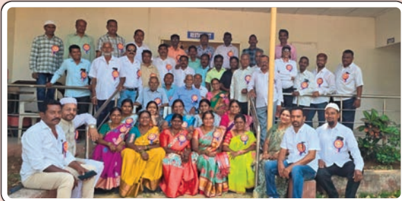
కడెం, ఫిబ్రవరి 21 (ప్రజా జ్యోతి):

నిర్మల్ జిల్లా కడెం మండల కేంద్రంలోని ప్రభుత్వ ఉన్నత పాఠశాలలో 10 వ తరగతి చదివిన పూర్వ విద్యార్థులు 35 ఏళ్ల తరువాత ఒక చోట కలిశారు. 1989-90 పదవ తరగతి బ్యాచ్ కు చెందిన పూర్వ విద్యార్థులు కడెంలో శుక్రవారం పూర్వ విద్యార్థుల అత్యీయ సమ్మేళనం నిర్వహించారు. ఈ సందర్భంగా అప్పుడు వీరికి విద్య నేర్పిన గురువులను ఆహ్వానించి శాలు వాలతో సన్మానించారు. అనంతరం అప్పుడు జరిగిన తీపి జ్ఞాపకాలను వారు నెమరువేసుకున్నారు.