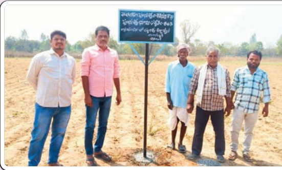
ప్రజాజ్యోతి ఫిబ్రవరి 20 (చెన్నూరు)