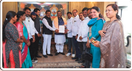
ఆదిలాబాద్ బ్యూరో ఫిబ్రవరి 20, (ప్రజాజ్యోతి)

కేంద్ర విద్యాశాఖ మంత్రి తో ఆ యన నివాసంలో సమావేశం