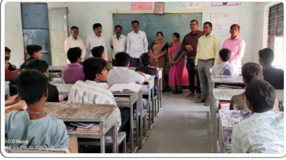
నార్సూర్ ఫిబ్రవరి 20 (ప్రజా జ్యోతి)

ప్రైవేట్ కళాశాలలకు మించిన మెరుగైన విద్యాబోధన అందిస్తున్న ప్రభుత్వ జూనియర్ కళాశాలల్లోనే విద్యార్థులను చేర్పించాలని నార్సూర్ ప్రభుత్వ జూనియర్ కళాశాల ఉపాధ్యాయ బృందం కోరారు. మండల కేంద్రంలోని ప్రభుత్వ జూనియర్ కళాశాల ప్రిన్సిపాల్ ఆధ్వర్యంలో అధ్యాపకులు మండలంలోని పాఠశాలలో టీం లుగా తిరుగుతూ. పదవ తరగతి చదువుతున్న విద్యార్థులకు, పదో తరగతి పూర్తి చేసుకున్న తరువాత విద్యార్థులు ప్రభుత్వ కళాశాలల్లో చేరాలని విద్యార్థులకు అవగాహన కల్పించడం జరిగింది. విద్యార్థులకు ప్రభుత్వ కళాశాలల్లో ఉన్న మెరుగైన వసతులను వివరించారు. ఉపకార వేతనాలు, ఉచిత పుస్తకాల అందజేత తదితర అంశాలపై వారికి అవగాహన కల్పించారు. ప్రభుత్వ