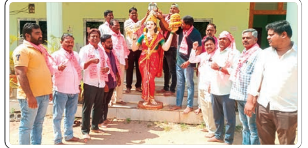
ఆదిలాబాద్ బ్యూరో ఫిబ్రవరి 20, (ప్రజాజ్యోతి)

బిఆర్ఎస్ ఆధ్వర్యంలో ఘనంగా తెలంగాణ బిల్ పాస్ దినోత్సవం