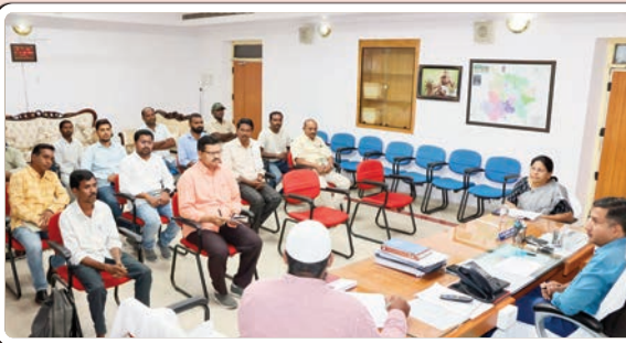
ఆదిలాబాద్ బ్యూరో ఫిబ్రవరి 20, (ప్రజాజ్యోతి)