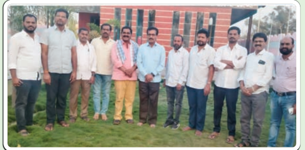
నార్సూర్ ఫిబ్రవరి 20 (ప్రజా జ్యోతి)