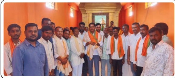
బోధ్, ఫిబ్రవరి 20 (ప్రజా జ్యోతి)

బోధ్ మండల కేంద్రంలోని సాయి నగర్ కాలనీలో గురువారం భక్తిశ్రద్ధలతో హనుమాన్ విగ్రహ ప్రతిష్ఠాపన కార్యక్రమంలో చట్ట ఉమ్మడి తో కలిసి ఆడే గజేందర్