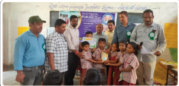
బేకులపల్లి, ఫిబ్రవరి 19, ప్రజాజ్యోతి :