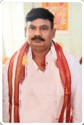
టూడుతూ భగవాన్ దాస్ కాలనీలోని

భద్రాచలం టౌన్, ఫిబ్రవరి 19, ప్రజాజ్యోతి :