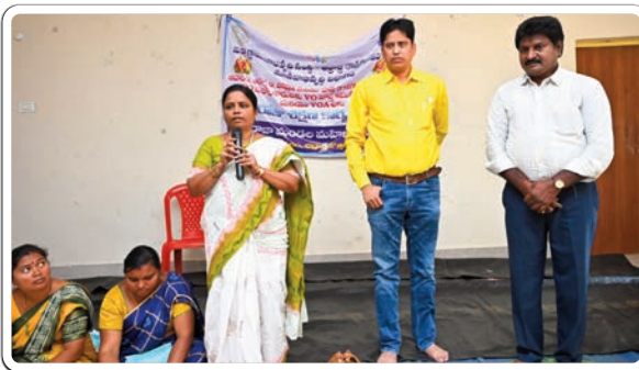
ఇల్లందు, ఫిబ్రవరి 19, ప్రజాజ్యోతి :