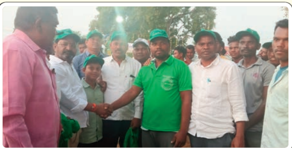
ఆళ్ళపల్లి, ఫిబ్రవరి 19, ప్రజాజ్యోతి :

ఆళ్ళపల్లి మండల పరిధిలోని మర్కేడు గ్రామపంచాయతీ పరిధిలో ఉన్న పెద్దూరు గ్రామంలో అత్యంత వైభవంగా జరగనున్న రెక్కల రామక్క జాతర మహోత్సవం మంగళవారం ప్రారంభమైంది. మంగళవారం రాత్రి ఆలయం వద్ద