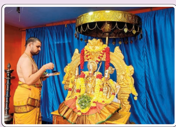
భద్రాచలం, ఫిబ్రవరి 19 (ప్రజాజ్యోతి) :

భద్రాచలంలోని శ్రీసీతారామచంద్రస్వామి ఆలయంలో సీతారాముల నిత్యకల్యాణం బుధవారం వైభవంగా నిర్వహించారు. తెల్లవారుజామున ఆలయ తలుపులు తెరిచి స్వామివారికి సుప్రభాతం పలికి, ఆరాధన, ఆరగింపు, సేవాకాలం, నిత్యహోమాలు, నిత్యబలిహరణం తదితర పూజలను భక్తిశ్రద్ధలతో నిర్వహించారు. నిత్యకల్యాణంలో పాల్గొన్న జంటలకు స్వామివారి ప్రసాదాలు, శేషస్నానాలు అందజేశారు.