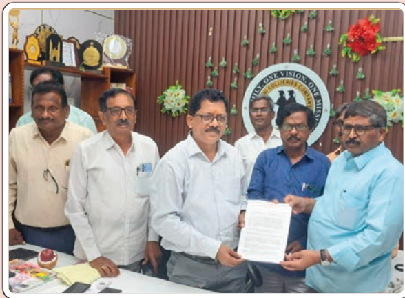
ఇల్లందు, ఫిబ్రవరి 19, ప్రజాజ్యోతి :