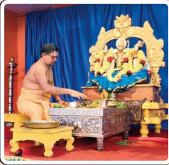
భద్రాచలం, జనవరి 31 (ప్రజాజ్యోతి):

భద్రాచలం శ్రీసీతారామచంద్రస్వామి దేవస్థానంలో శుక్రవారం అంతరాలయంలోని మూలవరులకు బెంగుళూరు భక్తులు రూ.5కోట్లతో తయారుచేయించి సమర్పించిన సర్వాంగ స్వర్ణ కవచాలంకరణను అర్చకులు ధరింపచేశారు. తెల్లవారుజామున ఆలయ తలుపులు తెరిచి స్వామివారికి సుప్రభాతసేవ, ఆరాధన, ఆరగింపు, నిత్య హోమాలు, నిత్యబలిహరణం తదితర నిత్యపూజలు జరిపారు. అనంతరం స్వామివారి నిత్యకల్యాణ మూర్తులను బేదా మండపానికి తీసుకువచ్చి నిత్య కల్యాణం నిర్వహించారు. కల్యాణంలో పాల్గొన్న దాతలకు శేషపస్త్రాలు, స్వామివారి ప్రసాదాలు అందజేశారు.