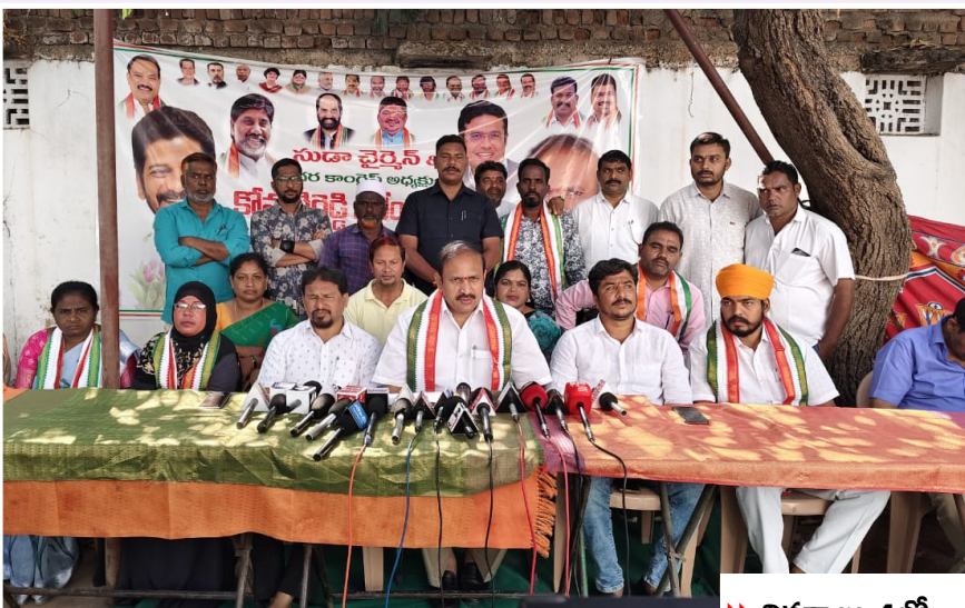
▶ వివరాలు 4లో..