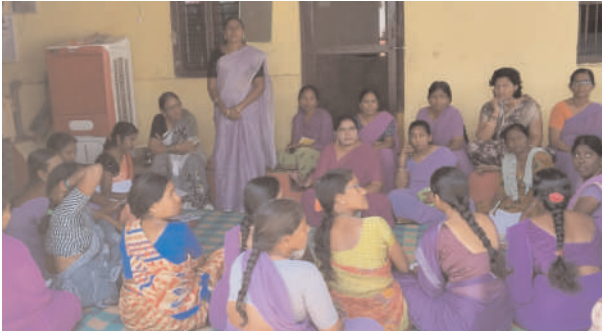
ఎల్కాతుర్తి ఫిబ్రవరి 19(ప్రజాజ్యోతి): ఆధ్వర్యంలో గర్భిణీ స్త్రీలు తమ ఎల్కాతుర్తి మండల కేంద్రంలోని మంగళవారం రోజున అంగన్వాడీ సెంటర్ వన్ అంబాల విజయ