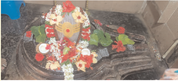
దామెర, ఫిబ్రవరి 18 (ప్రజాజ్యోతి):

దామెర మండలం ఊరుగొండ గ్రామంలోని శ్రీ భవని రామలింగేశ్వర స్వామి దేవాలయములో మహా శివరాత్రి బ్రహ్మోత్సవములు, శ్రీ శివ పార్వతుల కళ్యాణ మహోత్సవములు నిర్వహించనున్నట్లు అర్చకులు, దేవాలయ అభివృద్ధి కమిటీ తెలిపారు. ఈ మేరకు కార్యక్రమ వివరాలు వెల్లడించారు. తేది. 24-02-2025 సోమవారం రోజున ఉదయం 6:00 గం?లకు గణపతి పూజ, రుద్రాభిషేకము 8:00 గం?లకు శ్రీ లక్ష్మీగణపతి, నవగ్రహ, రుద్ర సహిత మహా మృత్యుంజయ హోమము. ఉదయం 11:05 ని?లకు శ్రీ శివ కళ్యాణ మహోత్సవము, మ? 1:00 గం?లకు మహా అన్నదాన కార్యక్రమము, సాయంత్రం 6.00 గంటలకు గ్రామంలో స్వామివారి ఊరేగింపు జరుపనున్నారు. తేది. 25-02-2025 మంగళవారం రోజున స్వామి వారికి అభిషేకములు, అర్చనలు, తేది. 26-02-2025 బుధవారం రోజున మహా శివరాత్రి రోజున ప్రాతఃకాల రుద్ర అభిషేకములు నిర్వహించనున్నారు. భక్తులు అధిక సంఖ్యలో పాల్గొని పారమేశ్వరులు ఆశీస్సులు పొందాలని అర్చకులు, దేవాలయ అభివృద్ధి కమిటీ మరియు గ్రామస్థులు కోరారు.