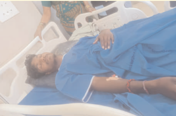
దామెర, ఫిబ్రవరి 18 (ప్రజాజ్యోతి):