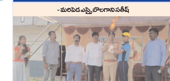
చదువుతో పాటు క్రీడల్లో కూడా రాణించాలి