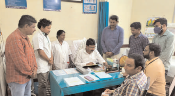
వాజేడు, ఫిబ్రవరి 18, ప్రజాజ్యోతి:

- ఆశ్రమ పాఠశాల విద్యార్థి విసీత్ మృతి పట్ల విచారణ