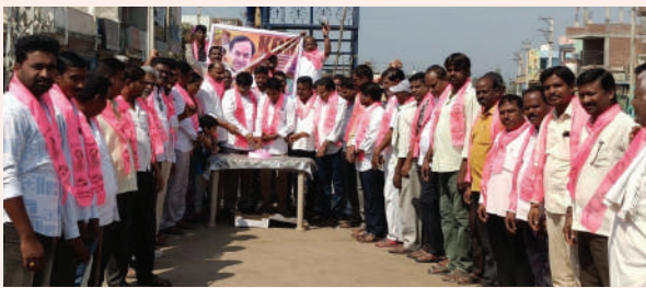
భీమదేవరపల్లి, ఫిబ్రవరి 17 (ప్రజా జ్యోతి):