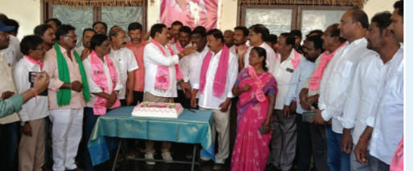
వర్ధన్నపేట ఫిబ్రవరి 17 (ప్రజాజ్యోతి):