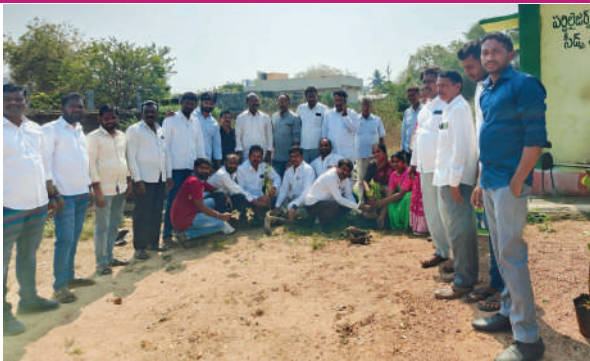
ఎల్లతుర్తి ఫిబ్రవరి 17(ప్రజాజ్యోతి):