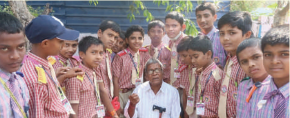
దామెర, ఫిబ్రవరి 17 (ప్రజాజ్యోతి) :