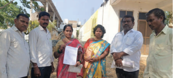
కమలాపూర్ ఫిబ్రవరి 17 (ప్రజాజ్యోతి):

- భూకబ్జాదారులతో వేగలేమంటూ మహిళకన్నీళ్లు - న్యాయం చేయాలంటూ స్టేషన్ మెట్టిక్కిన బాధితులు