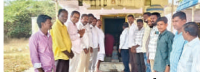
రాయపర్తి, ఫిబ్రవరి 17 (ప్రజా జ్యోతి):

రాయపర్తి గ్రామ బి.ఆర్.ఎస్ పార్టీ ఆధ్వర్యంలో సోమవారం భారత రాష్ట్ర సమితి అధినేత, తెలంగాణ రాష్ట్ర తొలి ముఖ్యమంత్రి కే. చంద్రశేఖర రావు 71వ జన్మదినోత్సవాన్ని పురస్కరించుకుని బి.ఆర్.ఎస్ గ్రామ పార్టీ ఆధ్వర్యంలో రాయపర్తి శివాలయంలో ప్రత్యేక పూజలు నిర్వహించి అనంతరం రాయపర్తి మండల ప్రాథమిక ఆరోగ్య కేంద్రంలో గర్భిణీ స్త్రీలకు పండ్లు పంపిన చేసి ఉద్యమ నాయకునికి జన్మదిన శుభాకాంక్షలు తెలిపిన బి.ఆర్.ఎస్ గ్రామ పార్టీ