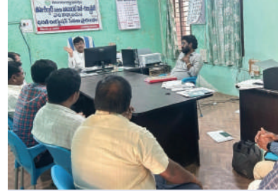
రాయపర్తి, ఫిబ్రవరి 17 (ప్రజా జ్యోతి):