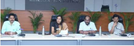
హనుమకొండ జిల్లా ప్రతినిధి: ఫిబ్రవరి 17, ప్రజా జ్యోతి.

-మహాశివరాత్రి ఉత్సవాల పోస్టర్ ఆవిష్కరణ: జిల్లా కలెక్టర్ ప్రావిణ్య