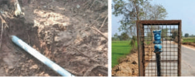
వర్షన్నపేట ఫిబ్రవరి 17 (ప్రజా జ్యోతి):

ఇష్టానుసారంగా ఆర్ అండ్ బి రోడ్డు పనులు, రోడ్డుకు ఇరువైపులా జెసిబి తో పొలాలను గండి కొడుతున్న