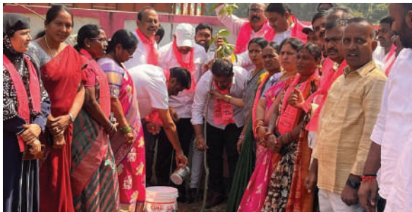
భూపాలపల్లి టౌన్, ఫిబ్రవరి