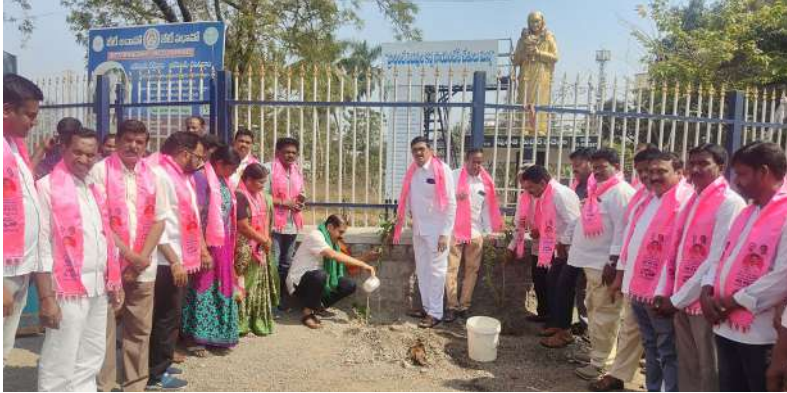
హనుమకొండ జిల్లా ప్రతినిధి, ఫిబ్రవరి 17, ప్రజా జ్యోతి :

- రాష్ట్రాన్నే సాధించిన సాధకుడు కేసీఆర్.. - మాజీ చీఫ్ విప్ దాస్యం వినయ్ భాస్కర్..