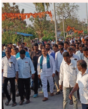
ఆత్మకూరు, ఫిబ్రవరి 17