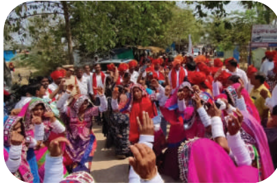
సంగం, ఫిబ్రవరి 17 (ప్రజాజ్యోతి) :