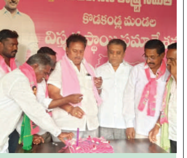
కొడకండ్ల / జనగామ, ఫిబ్రవరి 17 (ప్రజాజ్యోతి):