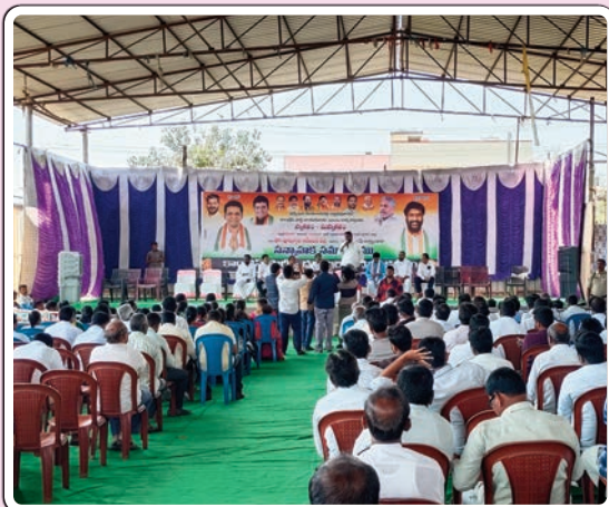
ధర్మపురి, ఫిబ్రవరి 14, ప్రజాజ్యోతి: