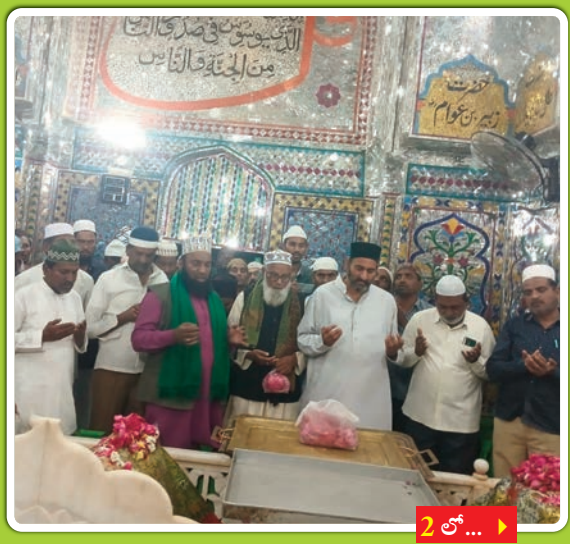
2 లో... >

బిజిగిర్ షరీఫ్ గ్రామంలో భక్తిశ్రద్ధలతో షబ్-బరాత్ వేడుకలు