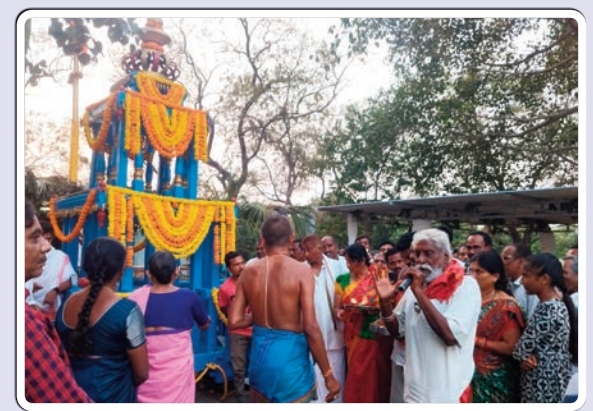
జగిత్యాల రూరల్, ఫిబ్రవరి 12, ప్రజాజ్యోతి

జగిత్యాల మండలం తాటిపెల్లి గ్రామంలోని శ్రీ వెంకటేశ్వర స్వామివారి 41వ బ్రహ్మోత్సవాల జాతర బుధవారం ముగిసింది ఫిబ్రవరి 8 నుండి ఫిబ్రవరి 12 వరకు అయిదు రోజుల గా స్వామివారి బ్రహ్మోత్సవాల ఘనంగా నిర్వహించారు చివరి రోజు బుధవారం న స్వామివారి కి రథోత్సవం, గోపాలకాలవలు, హోమం ,