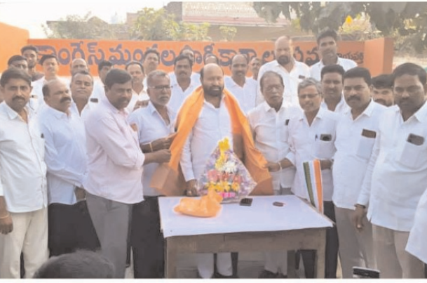
రాయవర్తి ఫిబ్రవరి 09