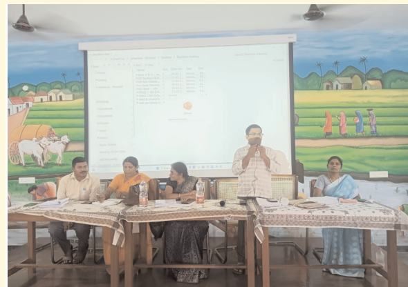
భీమదేవరపల్లి ఫిబ్రవరి 11