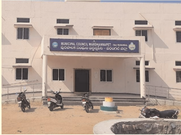
వర్ణస్పేట ఫిబ్రవరి 11