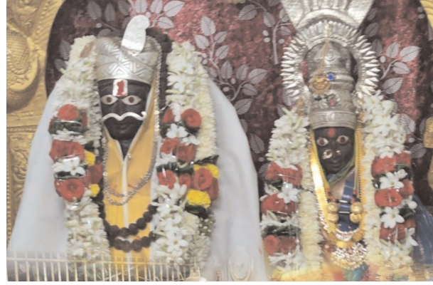
డోర్కల్ ఫిబ్రవరి 11