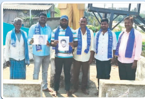
అశ్యాపురం, ఫిబ్రవరి 9 ప్రజాజ్యోతి

సుప్రీంకోర్టు తీర్పుకు విరుద్ధంగా SC వర్గీకరణ మాల జన సమితి ఆధ్వర్యంలో భారీనిరసన