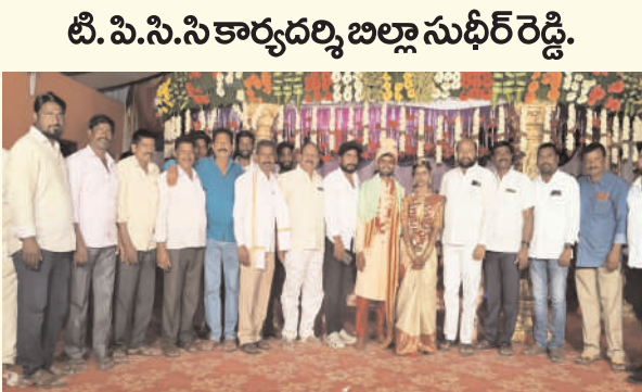
రాయపర్తి, ఫిబ్రవరి 13 (ప్రజాజ్యోతి):