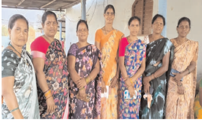
ఎకరానికి లక్ష రూపాయలు ఇవ్వాలని తెలిపారు. ఈ కార్యక్రమంలో డిమాండ్ చేశారు. పట్టా భూములకు మండలంలోని అన్ని గ్రామాల ఇసుక సాస్టైటిల్ సభ్యులు పాల్గొన్నారు.