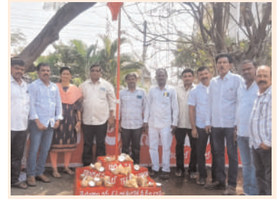
వరంగల్ సీటీ, ఫిబ్రవరి 13 (ప్రజా జ్యోతి):