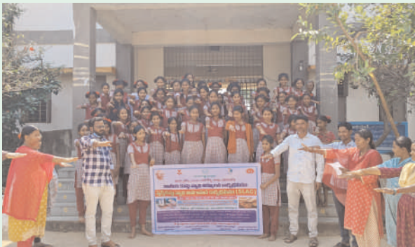
వాజేడు ఫిబ్రవరి 12 (ప్రజాజ్యోతి):

-వసతి గృహాలలోని విద్యార్థులకు కుష్టు వ్యాధి భిలగాహన