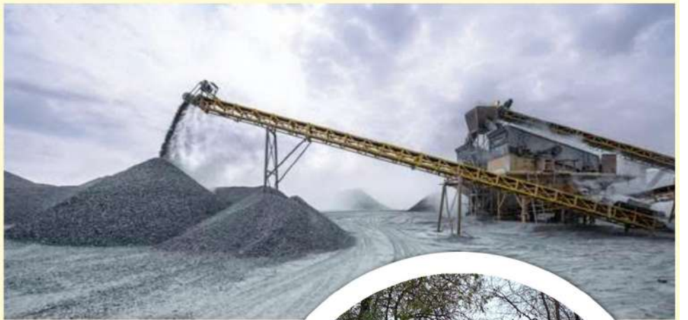
ఉమ్మడి వరంగల్ జిల్లాలో