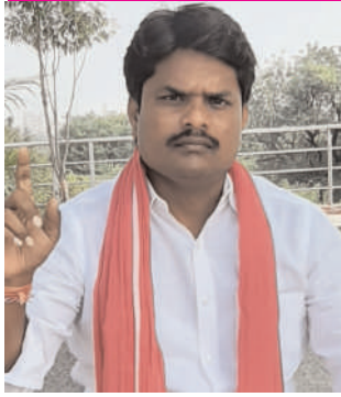
భీమదేవరపల్లి ఫిబ్రవరి 12 (ప్రజాజ్యోతి):