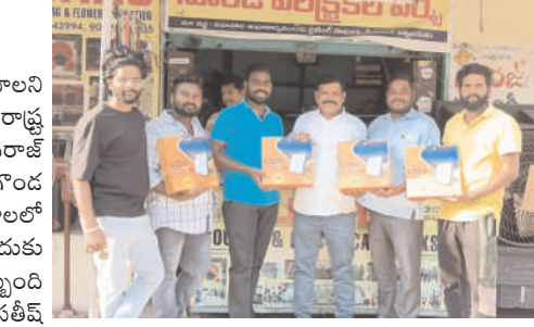
యువకులకు ఎల్ఈడి లైట్లు అందించారు. 120