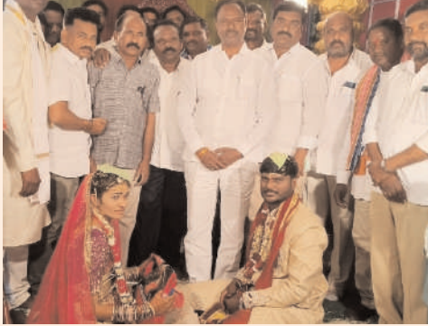
తేకుమట్ల ఫిబ్రవరి 13