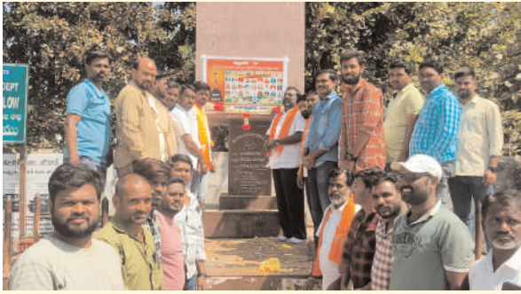
తొర్రూరు, ఫిబ్రవరి 12 (ప్రజాజ్యోతి):