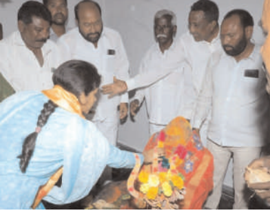
రాయపర్తి, ఫిబ్రవరి 12 (ప్రజాజ్యోతి):