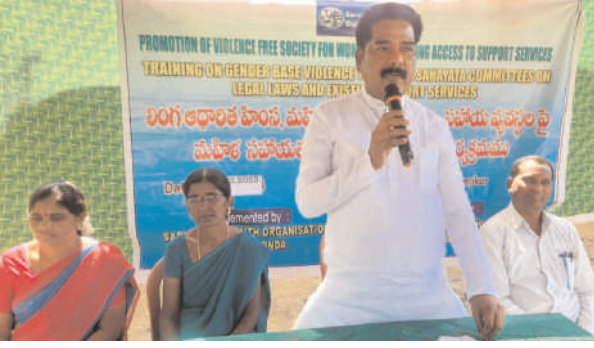
ఆత్మకూరు, ఫిబ్రవరి 14 (ప్రజాజ్యోతి):