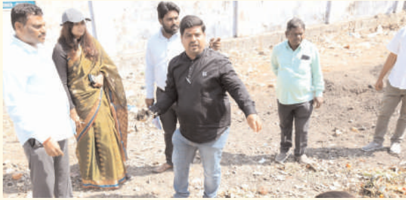
వరంగల్ సీటీ, ఫిబ్రవరి 14 (ప్రజాజ్యోతి):

-కంపోస్టు యూనిట్ ను ఆకస్మికంగా తనిఖీ చేసిన కమిషనర్