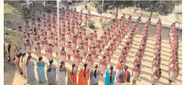
సంగం, ఫిబ్రవరి 14 (ప్రజాజ్యోతి):

ప్రపంచ వ్యాప్తంగా ప్రజలు ఫిబ్రవరి 14ను ప్రేమికుల రోజును ఘనంగా జరుపుకుంటున్నారు. కానీ, భారత్ కు మాత్రం బ్లాక్ డే.. 2019లో ఇదే రోజున జమ్మూ కశ్మీర్ లోని పుల్వూమాలో ఉగ్రవాదులు జరిపిన దాడిలో 40 మంది జవాన్లు వీరమరణం పొందారు. ఈ ఘటన జరిగిన తరువాత ఆరేళ్లు, శుక్రవారం రోజున సంగం మండలంలోని ప్రభుత్వ జూనియర్ కళాశాల, కస్తూరిబా గాంధీ బాలికల విద్యాలయం, విద్యాభారతి హైస్కూల్ లో ప్రాణాలు కొల్పోయిన జవాన్లను గుర్తుచేసుకుంటూ.. రెండు నిమిషాలు మౌనం పాటించారు. ఈ సందర్భంగా ఉపాధ్యాయులు మాట్లాడుతూ.. 2019 ఫిబ్రవరి 14న జమ్మూ-శ్రీనగర్ జాతీయ రహదారిపై లేతపూర (అవంతిపురా సమీపం)లో బస్సులో ప్రయాణిస్తున్న సైనికులపై ఉగ్రవాదులు అత్యహతని దాడికి పాల్పడ్డారని, దాదాపుగా 2500 మంది సైనికులతో 78 బస్సులు వెళ్తున్న సమయంలో 5వ బస్సుపై ఈ దాడి జరిగిందని, దాడిలో పాల్గొన్న ఆ ఉగ్రవాది కూడా హతమయ్యాడు. జైషే మొహమ్మద్ ఉగ్రవాద సంస్థ ఈ దాడికి పాల్పడింది. ఈ ప్రమాదంలో బస్సు తునాతునకైంది. జవాన్ల శరీరాలు చిద్రమయ్యాయి. ఈ దాడి తర్వాత అక్కడే దాక్కున్న ఉగ్రవాదులు సైనికుల పైకి విచక్షణారహితంగా కాల్పులు జరిపారు. వెంటనే దాడి నుంచి తేరుకున్న జవాన్లు ప్రతిదాడి చేశారని వారు గుర్తుచేశారు. ఉపాధ్యాయులు విద్యార్థిని విద్యార్థులు పాల్గొన్నారు.