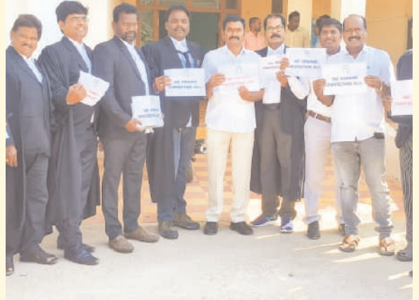
తొర్రూరు, ఫిబ్రవరి 14 (ప్రజాజ్యోతి):