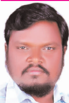
వరంగల్ సీటీ, ఫిబ్రవరి 14 (ప్రజాజ్యోతి):