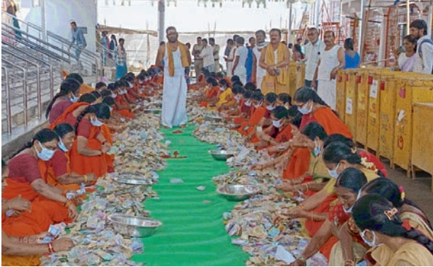
కొత్తకొండ వీరభద్ర స్వామి హుండ్లీ లెక్కింపు...