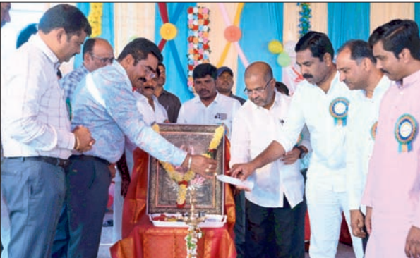
హనుమకొండ జిల్లా ప్రతినిధి: జనవరి 25, ప్రజా జ్యోతి.