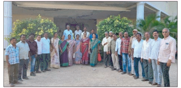
భీమదేవరపల్లి జనవరి 19 ప్రజా జ్యోతి

1984..85 సంవత్సర విద్యార్థులు 40 సంవత్సరాల వార్షికోత్సవం సభకు ముందస్తు ఏర్పాట్లను పూర్వ విద్యార్థులు పర్యవేక్షించారు. ఆదివారం మండలంలోని కొత్తకొండ దేవాలయం వద్ద ఏర్పాటు చేసుకున్న పూర్వ విద్యార్థులు జిల్లా సెకండరీ పాఠశాల వేలేర్ లో 1984..85 సంవత్సరంలో పదో తరగతి చదివిన విద్యార్థిని ,విద్యార్థులు, ఉపాధ్యాయులు కలుసుకొని ఘనంగా పూర్వ విద్యార్థుల సమ్మేళనాన్ని ఏప్రిల్ ..28 ..2025 సంవత్సరంలో ధర్మసాగర్ మండల్ వేలేరు ఉన్నత పాఠశాల ఆవరణలో ఏర్పాటు చేసుకోనున్నట్లు ఈ సందర్భంగా తెలిపారు. 40 సంవత్సరాల తర్వాత అనాటి జ్ఞాపకాలను గుర్తు చేసుకోవడం జరిగినది. 40 సంవత్సరాల అపూర్వ కలయిక , పూర్వ విద్యార్థుల ఆత్మీయ సమ్మేళనం,ఘనంగా జరుపుకోవడం జరిగింది. చిన్ననాటి జ్ఞాపకాలను మిత్రులందరు చర్చించుకుంటూ ఆనందంగా గడపడం జరిగింది. ఎవరికి ఏ కష్టం వచ్చినా మేమున్నామని మనోధైర్యాన్ని కల్పించాలని హాజరైన మిత్రులు తెలిపారు. ఈ సందర్భంగా హాజరైన మిత్రులకు ప్రత్యేక కృతజ్ఞతలు తెలియజేశారు.