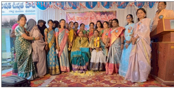
గార్ల,జనవరి 19 (ప్రజా జ్యోతి)

గార్ల మండలంలోని జిల్లా పరిషత్ ఉన్నత పాఠశాల లో 1997-98లో పదో తరగతి చదివిన పూర్వవిద్యార్థులు ఆదివారం ఆత్మీయ సమ్మేళనం నిర్వహించారు. ఈ సందర్భంగా ఎక్కడెక్కడో స్థిరపడిన వారంతా ఒకచోట చేరి గత అనుభవాలు గుర్తు చేసుకున్నారు. 28 సంవత్సరాల తర్వాత కలుసుకున్న వారంతా ఒకరికొకరు పలకరించుకొని వారి జీవన స్థితిగతులు పంచుకుని రోజంతా ఆనందంగా గడిపారు. అనంతరం ఆనాటి ఉపాధ్యాయులను పూర్వ విద్యార్థులు సన్మానించారు. గార్ల జిల్లా పరిషత్ ఉన్నత పాఠశాల