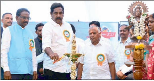
హనున్ పర్తి, జనవరి-11(ప్రజాజ్యోతి):