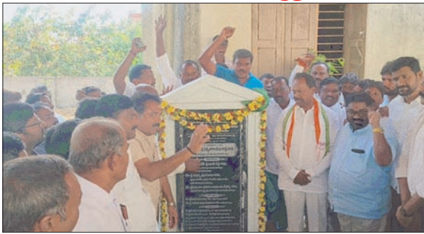
ఇచ్చారు. రాష్ట్ర ప్రభుత్వం మంజూరు చేస్తున్న రూ. ఐదు లక్షలతో ఇంటి నిర్మాణం పూర్తవుతుందా అనే సందేహం ప్రజల్లో నెలకొన్న నేపథ్యంలో.. అట్టి సందేహాన్ని నివృత్తి చేసేందుకే ఈరోజు రూ.5 లక్షలతో ఇంటి నిర్మాణం పూర్తి చేసి ప్రజలకు అవగాహన కల్పించనున్నట్లు ఎమ్మెల్యే . ఈ కార్యక్రమంలో ఎమ్మెల్యే వెంట పెద్ద సంఖ్యలో కాంగ్రెస్ నేతలు, కార్యకర్తలు అధికారులు తదితరులు పాల్గొన్నారు .

రేగోండ జనవరి 11 ప్రజాజ్యోతి న్యూస్ రాజోయే నాలుగేళ్లలో పేదవాడి సొంతింటి కల నెరవేర్చే దిశగా ప్రజా ప్రభుత్వం ఇందిరమ్మ ఇళ్ల కార్యక్రమం చేపట్టినట్లు భూపాలపల్లి ఎమ్మెల్యే గండ్ర సత్యనారాయణ రావు అన్నారు. శనివారం రోజున భూపాలపల్లి నియోజకవర్గం రేగోండ మండల కేంద్రంలోని స్థానిక ఎంపిడిఓ కార్యాలయ ఆవరణలో రూ.5 లక్షలతో నిర్మించనున్న మోడల్ ఇందిరమ్మ ఇంటి నిర్మాణ పనులకు ఎమ్మెల్యే గండ్ర సత్యనారాయణ రావు కాంగ్రెస్ నేతలతో కలిసి శంకుస్థాపన చేశారు. అనంతరం రైతు వేదికలో రేగోండ, కొత్తపల్లిగోరి మండలాల్లోని వివిధ గ్రామాలకు చెందిన మొత్తం 23 మంది కళ్యాణలక్ష్మి %౬% షాదీ ముబారక్ లబ్ధిదారులకు రూ.23,02,668 విలువ కలిగిన చెక్కులను ఎమ్మెల్యే పంపిణీ చేశారు. ఈ సందర్భంగా ఎమ్మెల్యే మాట్లాడుతూనియోజకవర్గంలో ఇందిరమ్మ ఇండ్ల లబ్ధిదారులను పారదర్శకంగా ఎంపిక చేసి, అర్హులైన పేదలందరికీ ఇందిరమ్మ ఇల్లు నిర్మించి ఇస్తామని హామీ