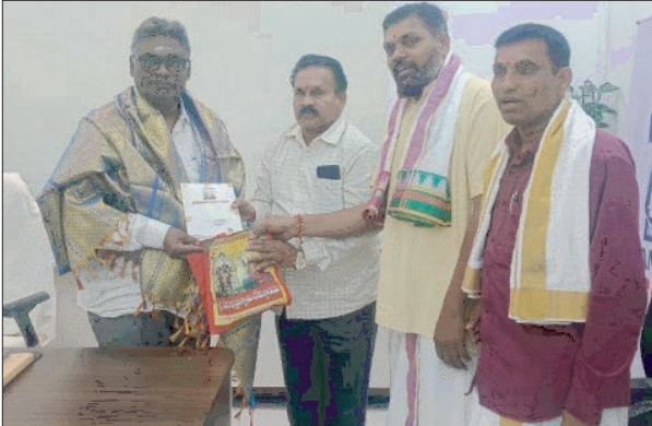
భీమదేవరపల్లి జనవరి 7 ప్రజా జ్యోతి....

తెలంగాణలో ప్రసిద్ధి చెందిన మండలంలోని కొత్తకొండ శ్రీ వీరభద్ర స్వామి బ్రహ్మోత్సవాలకు రావాలని పార్లమెంట్ సభ్యులు