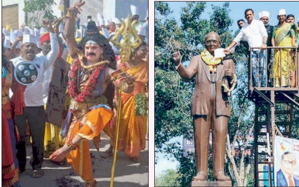
తెలంగాణ సాంస్కృతికత ఉట్టిపడేలా వేసాధారణలతో ర్యాలీ భీమదేవరపల్లి జనవరి 2 ప్రజా జ్యోతి....