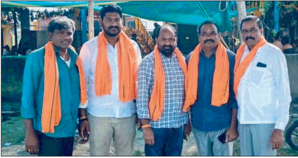
శరణు ఘోషతో దద్దరిల్లిన ఆలయ ప్రాంగణం...