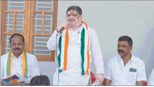
పార్టీ కోసం కష్టపడిన వారికి పదవులు అవే వస్తాయి... కార్యకర్తలతో మంత్రి పొన్నం ప్రభాకర్ ఎల్లతుర్తి జనవరి 2 ప్రజా జ్యోతి....

మండలంలోని ప్రతి గ్రామంలో స్థానిక సంస్థల ఎన్నికలలో కాంగ్రెస్ జెండా ఎగురవేయాలని మంత్రి పొన్నం ప్రభాకర్ కార్యకర్తలకు సూచించారు. గురువారం మండల కేంద్రంలో ముఖ్య నేతలు, కార్యకర్తలతో మంత్రి పొన్నం ప్రభాకర్ సమావేశం ఏర్పాటు చేశారు. ఈ సందర్భంగా కార్యకర్తలతో మంత్రి పొన్నం ప్రభాకర్ మాట్లాడుతూ స్థానిక సంస్థల ఎన్నికల్లో ఐక్యంగా కలిసి పనిచేయాలని ప్రతి గ్రామంలో కాంగ్రెస్ జెండా ఎగురవేయాలని అన్నారు. కార్యకర్తలు పార్టీ బలోపేతానికి కృషి చేయాలి.. ప్రజా పాలన ప్రభుత్వం అమలు చేస్తున్న కార్యక్రమాల్లో గ్రామగ్రామాన ప్రతి ఇంటింటికీ అవగాహన కల్పించాలి అన్నారు. కాంగ్రెస్ ప్రభుత్వం ఇచ్చిన మాట ప్రకారం రైతులకు 2 లక్షల రూపాయల రుణమాఫీ పూర్తి చేసింది. 200 యూనిట్ల ఉచిత విద్యుత్, 500 కి