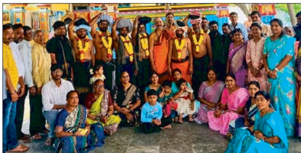
- కుటుంబ సభ్యుల సమక్షంలో ఇరుముడి కట్టిన స్వాములు వరంగల్ సీటీ జనవరి 2(ప్రజాజ్యోతి):

అత్యంత భక్తిశ్రద్ధలతో నియమనిష్ఠతో అయ్యప్ప స్వామి మండల దీక్ష తీసుకున్న అయ్యప్ప స్వాములు ఇరుముడి కట్టుకొని శబరిమలకు వెళ్లే కార్యక్రమం అత్యంత ఘనంగా నిర్వహించారు.