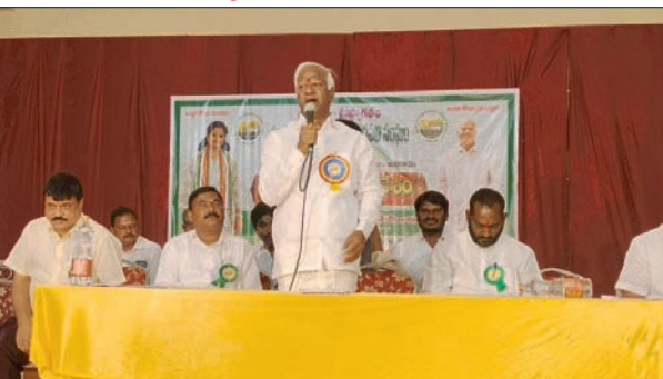
మున్నూరు కాపు మినీ ఫంక్షన్ హాల్ నిర్మాణానికి 20 లక్షలు మంజూరు చేస్తున్నట్లు ప్రకటించారు. వచ్చే ఏడాది రెండవ వార్షికోత్సవం నూతన ఫంక్షన్ హాల్లో జరుపుకోవాలని సూచించారు. ఈ కార్యక్రమంలో మున్నూరు కాపు పరపతి సంఘం కార్యవర్గం, సభ్యులు, స్థానిక ప్రజా ప్రతినిధులు, నాయకులు, కార్యకర్తలు తదితరులు పాల్గొన్నారు.