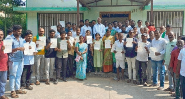
అనారోగ్యానికి గురై ఆర్థికంగా ఇబ్బంది పడుతున్న ఎంతో నిరుపేద ప్రజలకు ముఖ్యమంత్రి సహాయ నిధి ద్వారా ఆర్థిక సహాయాన్ని అందిస్తున్నట్లు వెల్లడించారు. ఆర్థికంగా ఎన్ని ఇబ్బందులు ఎదురైనప్పటికీ పేద ప్రజల సంక్షేమానికి పెద్ద పీట వేస్తున్నట్లు తెలిపారు. వ్యవసాయ మార్కెట్ చైర్ పర్సన్ జూలుకుంట్ల లావణ్య రెడ్డి, కాంగ్రెస్ పార్టీ మండల అధ్యక్షుడు జూలుకుంట్ల శిరీష్ రెడ్డి, సీల గట్టయ్య, బూర్ల శంకర్, పోగుల సారంగపాణి, స్థానిక ప్రజా ప్రతినిధులు, అధికారులు, నాయకులు, కార్యకర్తలు, లబ్ధిదారులు తదితరులు పాల్గొన్నారు.

స్టేషన్ ఘనపూర్ ప్రతినిధి, జనవరి 05 ( ప్రజాజ్యోతి ) :- స్టేషన్ ఘనపూర్ మండల కేంద్రంలోని రైతు వేదికలో ఆదివారం ఏర్పాటు చేసిన ముఖ్యమంత్రి సహాయ నిధి చెక్కుల పంపిణీ కార్యక్రమానికి మాజీ ఉప ముఖ్యమంత్రి, స్టేషన్ ఘనపూర్ ఎమ్మెల్యే కడియం శ్రీహరి ముఖ్య అతిథిగా హాజరయ్యారు. ఈ సందర్భంగా జఫర్ గడ్డ మండలానికి చెందిన 14 మందికి 5 లక్షల 31 వేల 500 రూపాయల విలువగల చెక్కులను, చిల్పూర్ మండలానికి చెందిన 6 కి 2 లక్షల 01 వేయి రూపాయల విలువగల చెక్కులను మరియు స్టేషన్ ఘనపూర్ మండలానికి చెందిన 15 మంది లబ్ధిదారులకు 5 లక్షల 72 వేల రూపాయల విలువగల చెక్కులను మొత్తం మూడు మండలాలకు సంబంధించిన మొత్తం 35 మంది ముఖ్యమంత్రి సహాయ నిధి లబ్ధిదారులకు 13 లక్షల 04 వేల 500 రూపాయల విలువగల చెక్కులను లబ్ధిదారులకు పంపిణీ చేశారు. అనంతరం ఎమ్మెల్యే మాట్లాడుతూ పేద ప్రజల ఆరోగ్యానికి ముఖ్యమంత్రి సహాయ నిధి ద్వారా రాష్ట్ర ప్రభుత్వం అండగా నిలుస్తుందని అన్నారు.