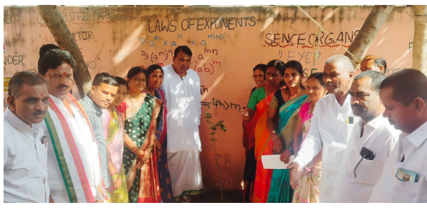
రాజంపేట (బాన్సువాడ) జనవరి 24 (ప్రజా జ్యోతి) జిల్లా మహిళా సంక్షేమ శాఖ