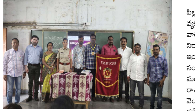
కొన్ని ప్రాంతాల్లో ఆడపిల్లలపై వివక్ష ఉందని చదువు ఉద్యోగం

బెల్లంపల్లి, జనవరి 24(ప్రజాజ్యోతి) : కంటికి రూపం ఇంటికి దీపం మమతకు అప్పురూపం నిండు గుండెకు ఆడపిల్లే మని రూపం సమాజానికి వెలుగు ఆడపిల్ల అని మూడం ఎన్నై సౌజన్య అన్నార శుక్రవారం రోజున వానవి క్షేత్ర ఆధ్వర్యంలో తాండూర్ మండల కేంద్రంలోని తంగళ్ళపల్లి ప్రభుత్వ ఉన్నత పాఠశాలలో జాతీయ బాలికల దినోత్సవం సందర్భంగా ముఖ్య అతిథిగా హాజరై మాట్లాడుతూ బాలికల హక్కులు విద్య ఆరోగ్య భద్రతపై అవగాహన కల్పిస్తూ సమాజంలో బాలికలపై జరుగుతున్న అపరాధాలు, మూసధోరణలు, మూఢన మృకాలు, మూసపద్ధతులను సవాలు చేస్తూ జాతీయ బాలికా దినోత్సవాన్ని జరుపుకుంటున్నామని 2025 వచ్చినా ఇప్పటికీ