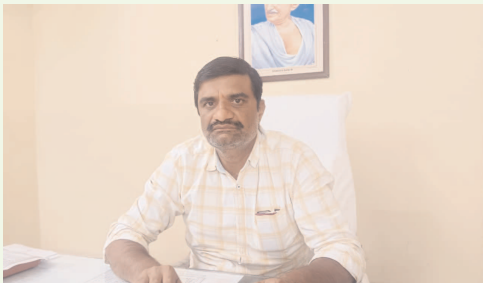
ఇల్లు రేషన్ కార్డులు తప్పనిసరి అందిస్తారు

మనోహరాబాద్, జనవరి 19 ( ప్రజా జ్యోతి ) మెడక్ జిల్లా మనోహరాబాద్ మండల వ్యాప్తంగా సర్వే నిర్వహించగా అందులో కొంతమంది 10 సంవత్సరాలుగా మీ సేవల ద్వారా రేషన్ కార్డులో తల్లిదండ్రుల పేర్లు ఉండి పిల్లల