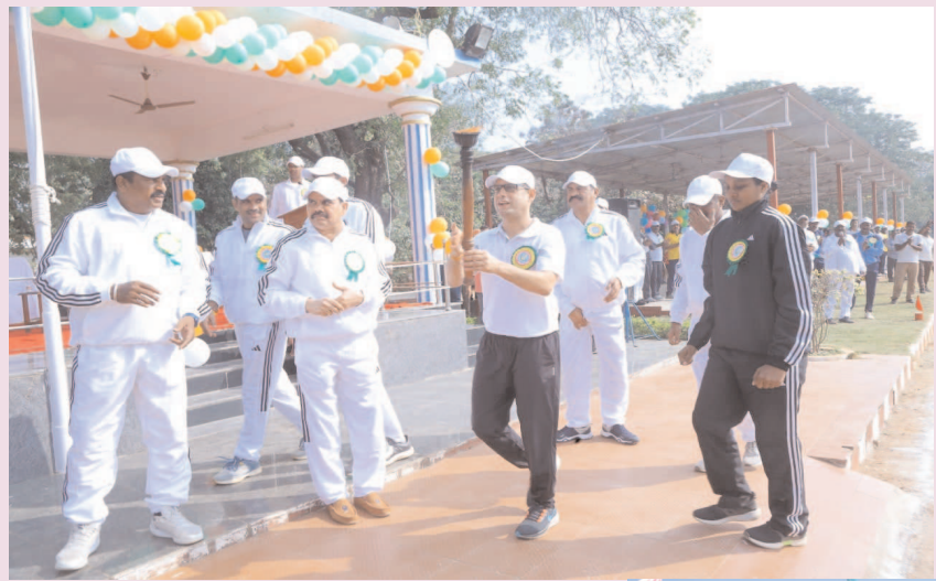
క్రీడలు ఐక్యతను చాటి చెబుతాయి :పోలీస్ కమిషనర్