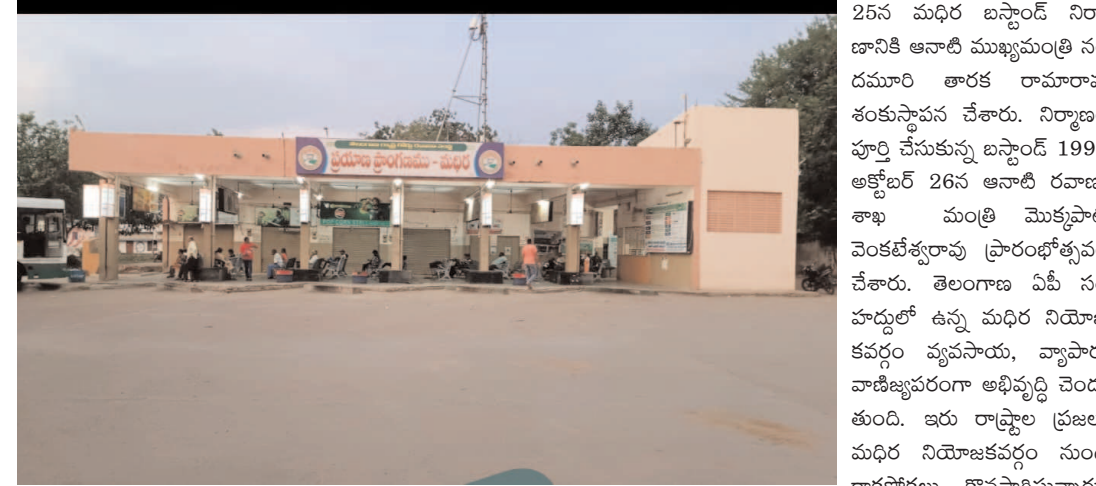
డిప్యూటీ సీఎం మల్లు భట్టి విక్రమార్కు ఆదేశాలతో నిధులు మంజూరు

మధుర బస్టాండ్ ఆధునీకరణ కోసం తెలంగాణ ఆర్టీసీ బోర్డు 10 కోట్ల రూపాయలు నిధులు మంజూరుకి ఆమోదం తెలిపింది. శనివారం హైదరాబాదులో జరిగిన ఆర్టీసీ బోర్డు సమావేశంలో ఈ నిర్ణయం తీసుకున్నారు. మధుర సుందరీకరణ కార్యక్రమంలో భాగంగా మధుర బస్టాండ్ ఆధునీకరణకు డిప్యూటీ సీఎం మల్లు భట్టి విక్రమార్కు ఆదేశాల మేరకు మధుర బస్టాండ్ ఆధునీకరణకు 10 కోట్ల రూపాయలు నిధులను ఆర్టీసీ బోర్డు మంజూరు చేశారు. నియోజకవర్గ ముఖ్య కేంద్రమైన మధుర పట్టణంలో 1984 ఏప్రిల్