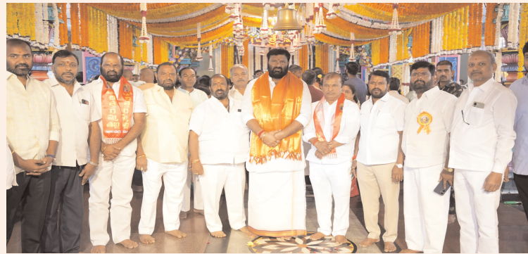
కుత్బుల్లాపూర్ జనవరి 19(ప్రజా జ్యోతి )