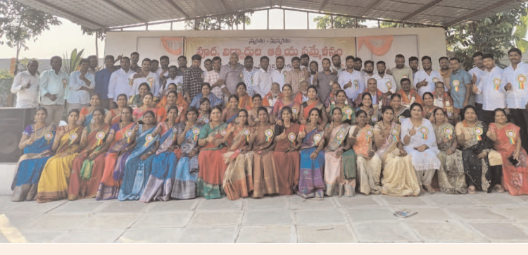
శంకర్పల్లి డిసెంబర్ 19( ప్రజా జ్యోతి )

19 సంవత్సరాల తర్వాత జీవితంలో స్థిరపడి ఒకే వేదికపై అందరూ చిన్ననాటి తరగతిగది చిలిపి చేపులను నెమరు వేసుకున్నారు. రాంగెడ్డి జిల్లా శంకర్ పల్లి మండలం దోబీపేట్ జిల్లా పరిషత్ ఉన్నత పాఠశాలలో 2005-06 సంవత్సరంలో పదవ తరగతి చదివి తదనంతరం వారి వారి వృత్తి ఉద్యోగాలలో స్థిరపడిపోయారు. వారంతా ప్రస్తుతం ఒకే వేదికపై కలుసుకొని తమ చిన్ననాటి అనుభవాలను వేదికపై పంచుకున్నారు. పాఠశాలలోని తరగతి గదిలో జరిగిన సంఘటనలను పూర్వ ఉపాధ్యాయులు, పూర్వ విద్యార్థుల సమక్షంలో వారి వారి అభిప్రాయాలను పంచుకున్నారు. ఆనందంగా గడిపారు. 19 సంవత్సరాల అనంతరం ఇలా అందరూ ఒకే వేదికపై కలుసుకోవడం సంతోషంగా ఉందని వారి వారి అభిప్రాయాలలో వెలి బుచ్చారు. అప్పట్లో ఉపాధ్యాయులుగా పనిచేసిన కాండం మాట్లాడుతూ 19 సంవత్సరాల తర్వాత ఒకే వేదికపై కలుసుకోవడం ఎంతో సంతోషంగా ఉందని వారు పేర్కొన్నారు.