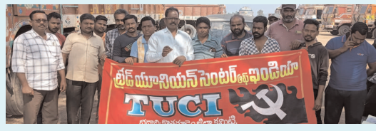
డ్రైవర్ల జిల్లా మహాసభకు తరలి రండి- టీయూసీఐ