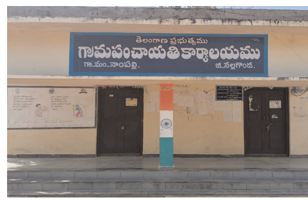
అంకాల పైన గ్రామ సభలు నిర్వహించనున్నట్లు నాంపల్లి ఎంపీడివో మేరీ స్వర్ణకుమారి ఒక ప్రకటనలో పేర్కొన్నారు.

తెలంగాణ రాష్ట్ర ప్రభుత్వం ప్రతిష్టాత్మకంగా చేపడుతున్న ప్రభుత్వ సంక్షేమ పథకాలు జిల్లా కలెక్టర్ ఇలా త్రిపాతి అదేశాల మేరకు నాంపల్లి మండల కేంద్రంలోని 32 గ్రామ పంచాయతీలలో ఈనెల 21నుంచి 24వరకు ప్రభుత్వ నిర్దేశించిన నాలుగు ప్రభుత్వ సంక్షేమ పథకాలు ఇందిరమ్మ ఇళ్లు, కొత్త రేషన్ కార్డులు, రైతు భరోసా(వ్యవసాయ వ్యవసాయేతర భూములు) ఇందిరమ్మ ఆశ్రయ భరోసా