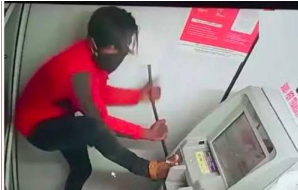
దొంగతనం జరిగే అవకాశం ఉండేది కాదు అని మండల ప్రజలు అంటున్నారు. పెట్రోలింగ్ పై పర్యవేక్షణ చేయాల్సిన అధికారులు ఇప్పటికైనా వారిపై నిఘా పెంచాలని కోరుతున్నారు.