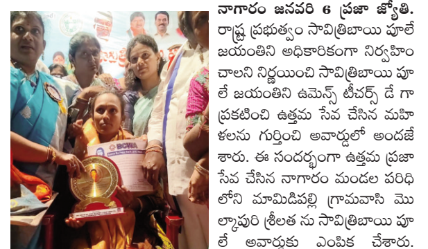
హైదరాబాదులోని రవీంద్రభారతిలో అవార్డును అందుకున్నట్లు ఆమె తెలిపారు. మండల వాసికి అరుదైన అవార్డు దక్కడంతో మండల ప్రజలు హర్షం వ్యక్తం చేశారు.