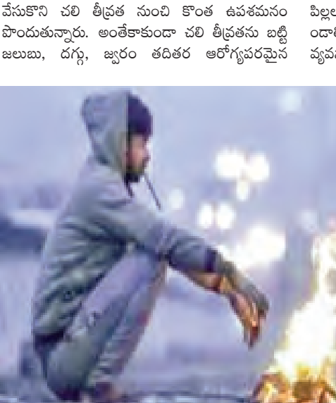
సమస్యలు ఉత్పన్నం కావడానికి అవకాశాలు మెండుగా ఉన్నాయి. వయసు పైబడిన వారు, చిన్న

ఇల్లందు/ జనవరి 5, (ప్రజాజ్యోతి) : గతంలో ఎన్నడూ లేని విధంగా చలి పంజా విసురుతుంది. దీంతో ప్రజలు తీవ్ర ఇబ్బందులకు గురవుతున్నారు. చలి తీవ్రత నుంచి శరీరాన్ని కాపాడుకునేందుకు ప్రతి ఒక్కరూ స్వేటర్లు, జర్మీన్ లు, ముసుగులను ధరిస్తున్నారు. చలి తీవ్రత కారణంగా ప్రధాన రహదారులు, వ్యాపార, వాణిజ్య సంస్థలు, మార్కెట్ లు ఉదయం వేలలో బోసిపోతున్నాయి. ఉదయం 8 గంటల వరకు మంచుకురవడంతో పాటు చలి గాలుల ప్రభావం ఎక్కువగా ఉంటుంది. ఆ గాలికి శరీరాన్ని కాపాడుకునేందుకు వినయోగించే ఉన్ని దుస్తులకు ప్రస్తుతం మంచి గిరాకీ ఉంది. చలి తీవ్రతకు తట్టుకోలేక కొంతమంది ద్వీపక వాహనదారులు రాత్రులు తమ ప్రయాణాలను రద్దు చేసుకుంటున్నారు. తెల్లవారుజామున 5 గంటల సుంచే పారిశుధ్య కార్మికులు, టి స్టాల్స్, ఆకుకూరలు అమ్మేవారు, షేపర్ బాయ్స్, ఆటో కార్మికులు, టిఫిన్ సింట్లర్లు, హోటల్స్ వారంతా పనుల్లో నిమగ్నమవుతుంటారు. రాత్రి సమయాల్లో భారీగా ఉష్ణోగ్రతలు పడిపోవడం వల్ల ప్రజలు మంటలు