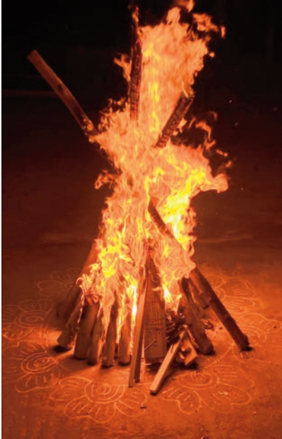
నల్లగొండ, ప్రజాజ్యోతి ప్రతినిధి: