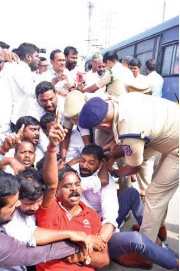
భువనగిరి, జనవరి 12 (ప్రజాజ్యోతి): యాదాద్రి భువనగిరి జిల్లా బి ఆర్ ఎస్ పార్టీ కార్యాలయం పై ఎన్ ఎస్ యు ఐ, యువజన

యాదాద్రి భువనగిరి జిల్లా బి ఆర్ ఎస్ పార్టీ కార్యాలయం పై ఎన్ ఎస్ యు ఐ, యువజన కాంగ్రెస్ నాయకులు ముకుమ్మడిగా దాడి చేసి పోలీసుల సమక్షంలో నే ఫర్మిచర్ ధ్వంసం చేయగా నిరసనగా, ఆదివారం భువనగిరి నియోజకవర్గం ఎమ్మెల్యే పైళ్ల శేఖర్ రెడ్డి ఆధ్వర్యంలో, పట్టణం లో ఆదివారం తన పార్టీ కి చెందిన నాయకులతో కార్యకర్తలతో కలిసి నిరసన తెలుపు తుండగా భారీ గా మొహరిం చిన పోలీసులు మాజీ ఎమ్మెల్యే ను అతడి అనుచరులను, కార్యకర్తలను అక్రమంగా అరెస్ట్ చేసి వనస్థలిపురం పోలీస్ స్టేషన్ కు తరలించడం జరిగింది.