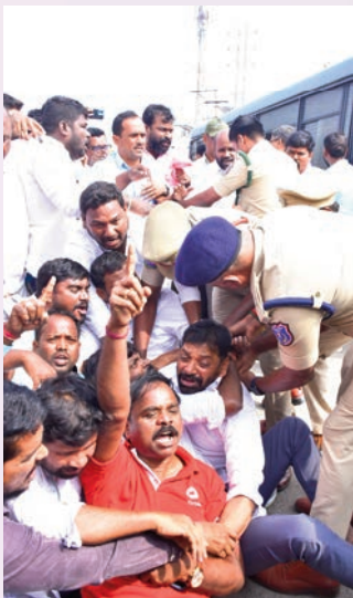
భువనగిరి, జనవరి 12 (ప్రజాజ్యోతి):