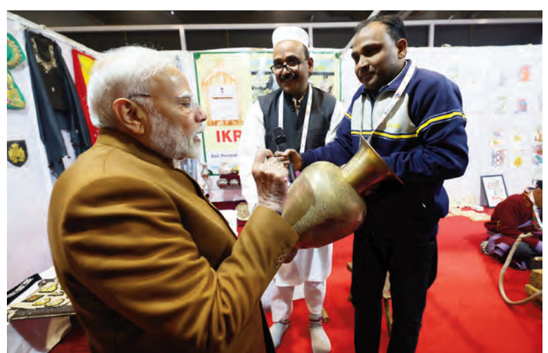
న్యూఢిల్లీ, జనవరి 4 (ప్రజాజ్యోతి): వెనకబడిన వర్గాలైన ఎస్సీ, ఎస్టీ, టిబీసీలను గత ప్రభుత్వాలు ఏమాత్రం పట్టించుకోలేదని ప్రధాని మోడీ విమర్శించారు. దాంతో గ్రామాల నుంచి పట్టణాలకు వలసలు పెరిగాయన్నారు. ఫలితంగా పట్టణాల్లోనూ పెదరికం పెరిగిపోయిందన్నారు. సమాజంలో ఎన్నో మార్పులు వస్తున్నా గ్రామాలకు, పట్టణాలకు మధ్య గ్యాప్ పెరుగుతూనే ఉందని ప్రధాని నరేంద్ర మోడీ ఆవేదన వ్యక్తం చేశారు. దేశ రాజధాని ఢిల్లీలో నిర్వహించిన గ్రామీణ భారత మహోత్సవం 2025 కార్యక్రమంలో ప్రధాని మోడీ పాల్గొన్నారు. ఈ సందర్భంగా ఆయన మాట్లాడుతూ.. దశాబ్దాలుగా అభివృద్ధికి నోచుకోని ప్రాంతాలు తమ పాలలో సమాన హక్కులు పొందుతున్నాయని నరేంద్ర మోడీ వెల్లడించారు. సమాజ సాధికారతే లక్ష్యంగా మిగతా 2లో..

గ్రామాల నుంచి పట్టణాలకు పెరిగిన వలసలు గ్రామాలకు, పట్టణాలకు మధ్య గ్యాప్ పెరుగుతూనే ఉంది గ్రామీణ భారత మహోత్సవంలో ప్రధాని మోడీ