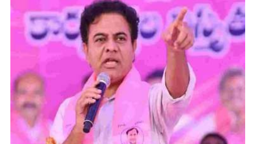
41 సార్లు ఎన్నికల బాండ్ల రూపంలో ముడుపులు చెల్లించింది. ఆ జాబితాను బయటపెట్టింది ప్రభుత్వం. రేస్ కు సంబంధించిన చర్చలు మొదలైనప్పటి నుంచి బాండ్లను కొనుగోలు చేసింది గ్రీన్ కో సంస్థ. 2022 8 ఏప్రిల్ నుంచి అక్టోబర్ 10 మధ్య ఆయా బాండ్లను కొనుగోలు చేసినట్లు

హైదరాబాద్ : పార్కులా ఈ కారు రేసులో కీలక విషయాలు బయటపెట్టింది తెలంగాణ ప్రభుత్వం. రేసు నిర్వహించిన గ్రీన్ కో సంస్థ ద్వారా బీఆర్ఎస్ కు కోట్లాది రూపాయల లబ్ధి చేకూరినట్లు వెల్లడించింది. ఎన్నికల బాండ్ల ద్వారా ఆ పార్టీకి రూ. 41 కోట్లు లబ్ధి చేకూరినట్లు తెల్పింది. దీంతో ఫ్యామిలీ ఈ కారు రేసు వ్యవహారం మరో మలుపు తిరిగింది. ఫ్యామిలీ ఈ కారు రేసు వ్యవహారం కొత్త మలుపు తిరిగింది. ఈ కేసులో ఏపీవీ విచారణకు దుమ్ము కొట్టారు మాజీ మంత్రి కేటీఆర్. ఈ క్రమంలో తెలంగాణ ప్రభుత్వం సంవలన విషయాలు బయటపెట్టింది. ఫ్యామిలీ- ఈ రేస్ నిర్వహించిన గ్రీన్ కో కంపెనీ ద్వారా బీఆర్ఎస్ పార్టీకి కోట్లాది రూపాయల లబ్ధి చేకూరిందని తెల్పింది. బీఆర్ఎస్ పార్టీకి ఎన్నికల బాండ్ల రూపంలో రూ. 41 కోట్లు చెల్లించింది గ్రీన్ కో సంస్థ. బీఆర్ఎస్ పార్టీకి గ్రీన్ కో, దాని అనుబంధ సంస్థలు ఏకంగా