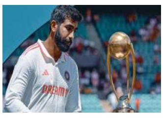
జస్ట్రిత్ బువ్రా ఈ సిరీస్ లో అత్యంత విజయవంతమైన బౌలర్. 5 మ్యాచ్ లో మొత్తం 32 వికెట్లు తీశాడు. ఈ కాలంలో అతని నగలు 13.06గా నిలిచింది. ఈ సిరీస్ లో, బువ్రా ఒక ఇన్నింగ్స్ లో మూడుసార్లు 5 వికెట్లు తీసిన ఘనతను సాధించారు. రెండుసార్లు ఒక ఇన్నింగ్స్ లో 4 వికెట్లు తీసుకున్నారు. బువ్రాతో పాటు, బోర్డర్-గవాస్కర్ ట్రోఫీ 2024-25లో టీమిండియా 1-3 తేడాతో ఓడిపోయింది. ఈ సిరీస్ లో తొలి మ్యాచ్ గెలిచినా.. ట్రోఫీని టీమిండియా నిలబెట్టుకోలేకపోయింది. కానీ భారత ఫాస్ట్ బౌలర్ జస్ట్రిత్ బువ్రాకు ఈ సిరీస్ చాలా ప్రత్యేకమైనది. అతను ప్రతి మ్యాచ్ లో అద్భుత ప్రదర్శనతో పాటు అత్యధిక వికెట్లు పడగొట్టాడు. కానీ అతనికీ ఇతర ఆటగాళ్ల నుంచి మద్దతు లభించలేదు. ఈ సిరీస్ లో టీమిండియా ఓడిపోయినప్పటికీ బువ్రాకు ఈ సిరీస్ లో అతిపెద్ద అవార్డు దక్కింది. అంటే, అతను తన చిరస్మరణీయ ప్రదర్శనకు షేయర్ ఆఫ్ ద సిరీస్ గా ఎంపికయ్యాడు.

ఈ సిరీస్ లో, ఆసియా ఆటగాడిగా అత్యధికంగా 5 వికెట్లు తీసిన సెనా దేశాలలో మూడో బౌలర్ గా బువ్రా నిలిచారు. సేనా దేశంలో అతను 9 సార్లు ఈ ఘనత సాధించారు. ఇప్పుడు ఈ జాబితాలో అతని కంటే ముత్యం మురళీధరన్, వసీం అక్రమ్ మాత్రమే ముందున్నారు. సేనా దేశాల్లో ముత్యం మురళీధరన్ 10 సార్లు, వసీం అక్రమ్ 11 సార్లు 5 వికెట్లు తీశారు. అంటే, గత టెస్టులో గాయం కారణంగా చివరి ఇన్నింగ్స్ లో బౌలింగ్ చేయలేకపోయినప్పటికీ, ఈ పర్యటన బువ్రాకు అనేక విధాలుగా మేలు చేసింది. అదే సమయంలో, ఒక భారత బౌలర్ విదేశాల్లో అదిన టెస్ట్ మ్యాచ్ లో ఇన్ని వికెట్లు తీయడం కూడా ఇదే మొదటిసారి. దీంతో బోర్డర్-గవాస్కర్ ట్రోఫీలో అత్యధిక వికెట్లు తీసిన భారత రికార్డును జస్ట్రిత్ బువ్రా సమం చేశాడు. స్వదేశంలో ఆస్ట్రేలియాతో జరిగిన టెస్టు సిరీస్ లో అత్యధిక వికెట్లు తీసిన భారత బౌలర్ గా కూడా జస్ట్రిత్ బువ్రా నిలిచారు. బిషప్ సింగ్ బేడీ పేరిట ఉన్న 47 ఏళ్ల రికార్డును బద్దలు కొట్టారు. 1977-78లో ఆస్ట్రేలియాలో జరిగిన టెస్టు సిరీస్ లో బేడీ 31 వికెట్లు తీశారు.