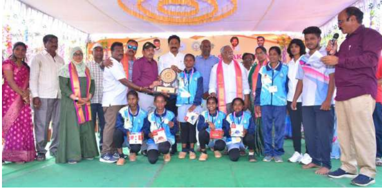
స్కూల్ గేమ్స్ అందరూ 14 జాతీయ సెవక్ తర్రా బాలికల చాంపియన్

విజయవాడ జనవరి 27: 68వ స్కూల్ గేమ్స్ ఫెడరేషన్ ఆఫ్ ఇండియా ఆధ్వర్యంలో పాఠశాల విద్యార్థులకు ఆంధ్రప్రదేశ్ స్కూల్ గేమ్స్ అథ్లెటిక్స్ స్కూల్ గేమ్స్ సంయుక్తంగా విజయవాడలోని స్థానిక పటమల జిల్లా పరిషత్ ఉన్నత పాఠశాల(బాలురు) నందు ఈ నెల 24 నుండి జరుగుతున్న ఈ టోర్నమెంట్ లో బాలికల విభాగంలో ఆంధ్రప్రదేశ్, బాలురు విభాగంలో మణిపూర్ జట్టు విజేతగా నిలిచాయి. సోమవారం జరిగిన బాలికల ఫైనల్ పోటీలో ఆంధ్రప్రదేశ్ జట్టు మణిపూర్ నీ 15-13, 17-15 పాయింట్స్ తేడాతో గెలిచి చాంపియన్ గా నిలిచింది. టోర్నమెంట్ ఆసాంతం ఆంధ్రప్రదేశ్ బాలికల జట్టు తనదైన అటాకింగ్, డిఫెన్స్ గేమ్ తో ప్రత్యర్థి జట్టుపై పూర్తి ఆధిక్యం కనబరుస్తూనే ఉంది. ఫైనల్ లో కూడా అదే