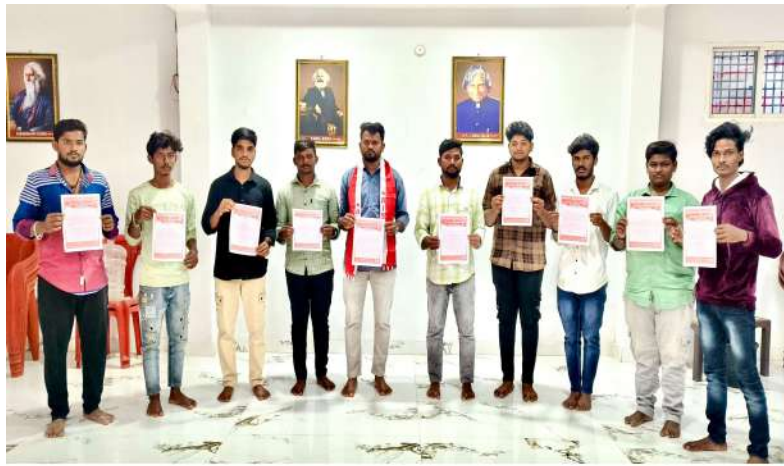
V30 Pro | 23mm f/1.88 1/100s ISO 1000