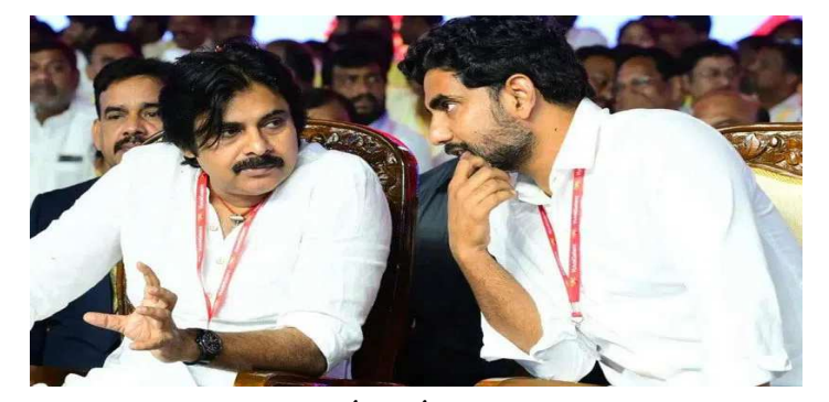
గుంటూరు జిల్లా ఏపీ రాజకీయాల్లో ఇప్పుడు ఓ కొత్త డిమాండ్ హాట్ టాపిక్ గా మారింది. ఏపీ సీఎం చంద్రబాబు తనయుడు, మంత్రి నారా లోకేశ్ కు డిప్యూటీ సీఎం పదవి ఇవ్వాలని తెలుగు తమ్ముళ్ల నుంచి కొద్దిరోజులగా పెద్ద ఎత్తున డిమాండ్ వినిపిస్తుంది. - మిగతా3లో