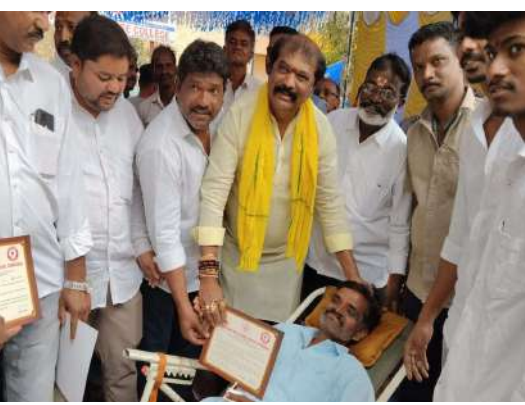
కార్యకర్తలు తదితరులు పాల్గొన్నారు.