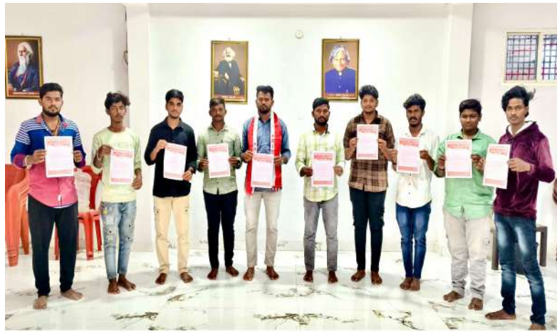
V30 Pro | 23mm f/1.88 1/100s ISO 1000