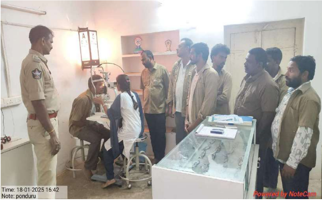
Time: 18-01-2025 16:42 Note: ponduru Powered by NoteCam