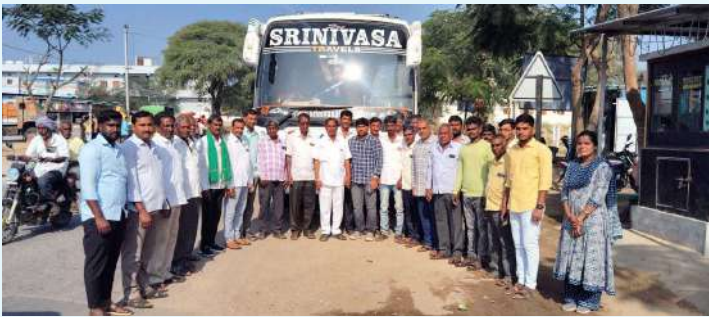
జగదేవపూర్, 06 జనవరి (ప్రజాజ్యోతి)

రాష్ట్రపతి నిలయం, బొల్లారం, సికింద్రాబాద్ నందు ఈ నెల 02 వ తేదీ నుండి 13 వ తేదీ వరకు జరగుచున్న ఉద్యాన ఉత్సవ్ కార్యక్రమంను ప్రత్యక్షంగా వీక్షించేందుకు మండలం నుండి సోమవారం 30 మంది ఉద్యాన మరియు ఇతర రైతులు తరలి వెళ్లినట్లు మండల వ్యవసాయ అధికారి తెలిపారు. ఈ కార్యక్రమంలో భాగంగా రైతులు పూల మరియు ఉద్యాన పంటల ఎగ్జిబిషన్ ను తిలకించి ఉద్యాన పంటల్లో వచ్చిన అధునాతన పద్ధతులు గురించి తెలుసుకోవచ్చును అన్నారు.