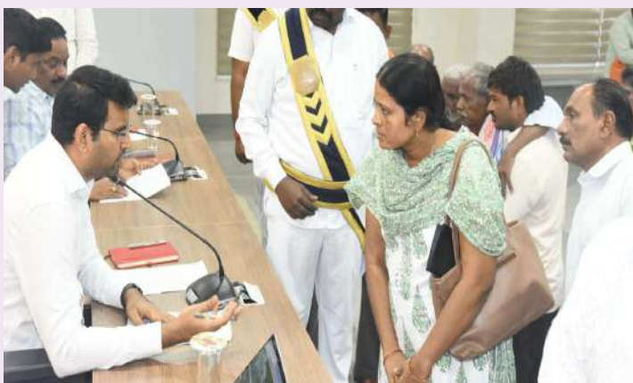
గద్వాల జనవరి 06 (ప్రజా జ్యోతి ప్రతినిధి):

ప్రజావాణి కార్యక్రమం ద్వారా ప్రజా సమస్యలను త్వరగా పరిష్కారం చేస్తున్నట్లు జిల్లా కలెక్టర్ బి.ఎం.సంతోష్ అన్నారు. సోమవారం కలెక్టర్ కార్యాలయములోని సమావేశ మందిరంలో నిర్వహించిన ప్రజావాణి కార్యక్రమంలో జిల్లాలోని వివిధ ప్రాంతాలకు చెందిన 47 మంది తమ సమస్యల పరిష్కారం కోసం దరఖాస్తు చేసుకున్నారని కలెక్టర్ తెలిపారు. ప్రజావాణి కార్యక్రమంలో వచ్చిన దరఖాస్తులపై అధికారులు ప్రత్యేక దృష్టి సారించి వెంటనే పరిష్కరించాలని సంబంధిత అధికారులను కలెక్టర్ ఆదేశించారు. ఈ కార్యక్రమంలో అదనపు కలెక్టర్లు లక్ష్మి నారాయణ, నర్సింగ్ రావు లతో కలిసి కలెక్టర్ ఫిర్యాదులను స్వీకరించారు. వివిధ శాఖల జిల్లా అధికారులు, తదితరులు పాల్గొన్నారు.