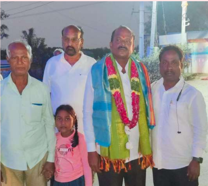
మొయినాబాద్ జనవరి 06 (ప్రజా జ్యోతి)

శుభాకాంక్షలు తెలియజేసిన యెన్కెపల్లి కాంగ్రెస్ నాయకులు