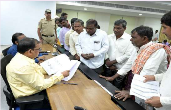
వికారాబాద్ ప్రతినిధి జనవరి 06 (ప్రజా జ్యోతి):