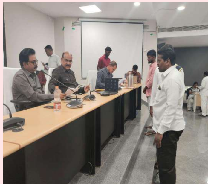
నాగర్ కర్నూలు, (టౌన్) జనవరి 06 ప్రజా జ్యోతి

ప్రజావాణి కార్యక్రమానికి వచ్చిన వినతులను క్షుణ్ణంగా పరిశీలించి సత్వరమే పరిష్కరించేందుకు సంబంధిత శాఖల అధికారులు కృషి చేయాలని అదనపు కలెక్టర్ కె.సీతారామారావు అన్నారు. ప్రజా సమస్యల పరిష్కారం కోసం కలెక్టర్ కార్యాలయం లో ప్రతి వారం నిర్వహించే ప్రజావాణి కార్యక్రమంలో భాగంగా సోమవారం నిర్వహించిన ప్రజావాణికి 29 వినతులు వచ్చాయి. అదనపు కలెక్టర్ కె.సీతారామారావు అధికారుల నుండి వినతులను స్వీకరించారు. అనంతరం అదనపు కలెక్టర్ కె.సీతారామారావు అధికారులతో మాట్లాడుతూ ప్రజావాణికి వచ్చిన వినతులను ఎలాంటి ఇబ్బందులు లేకుండా పరిశీలించి పరిష్కారం ఇవ్వాలని అధికారులను ఆదేశించారు. కలెక్టరేట్ ఏవో చంద్రశేఖర్, కలెక్టర్ విభాగాల సూపరిండెంట్లు, సంబంధిత శాఖల అధికారులు, తదితరులు పాల్గొన్నారు.