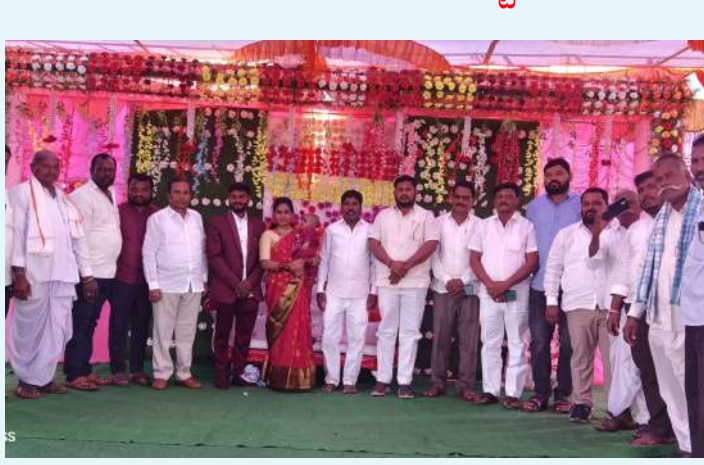
జహీరాబాద్, జనవరి 06( ప్రజా జ్యోతి స్టూస్ )

- కొనింటి మాణిక్ రావు మండల పార్టీ నాయకులు