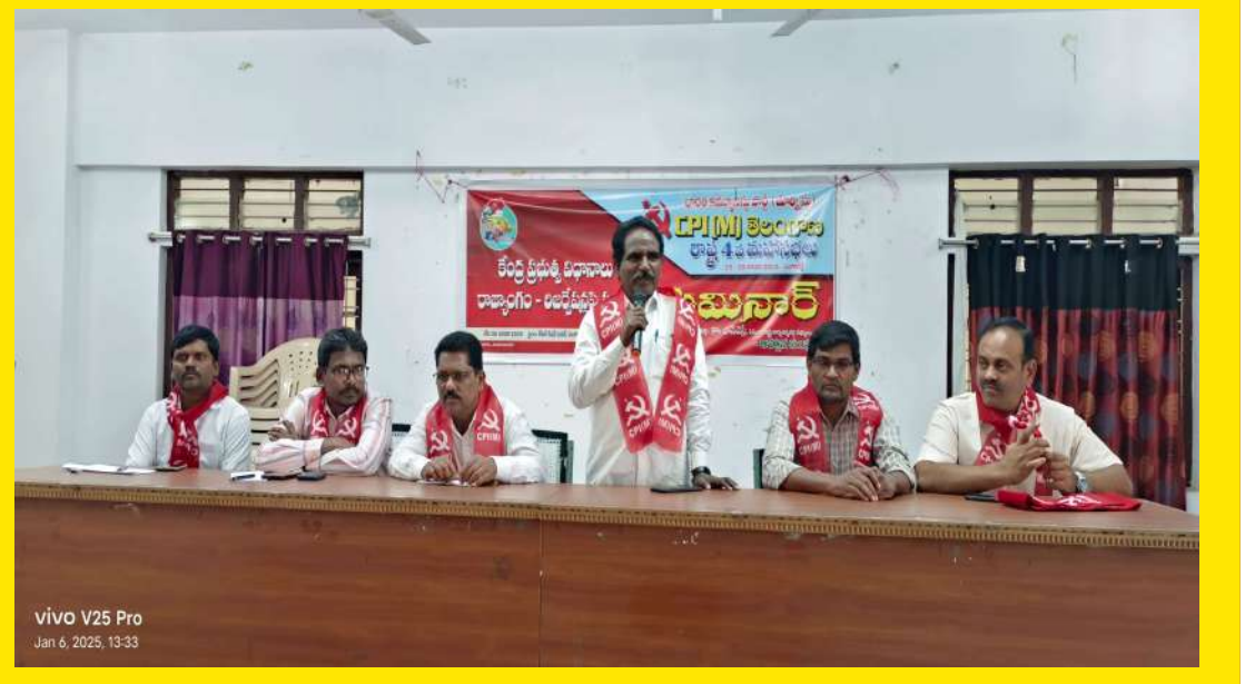
Vivo V25 Pro Jan 6, 2025, 13:33