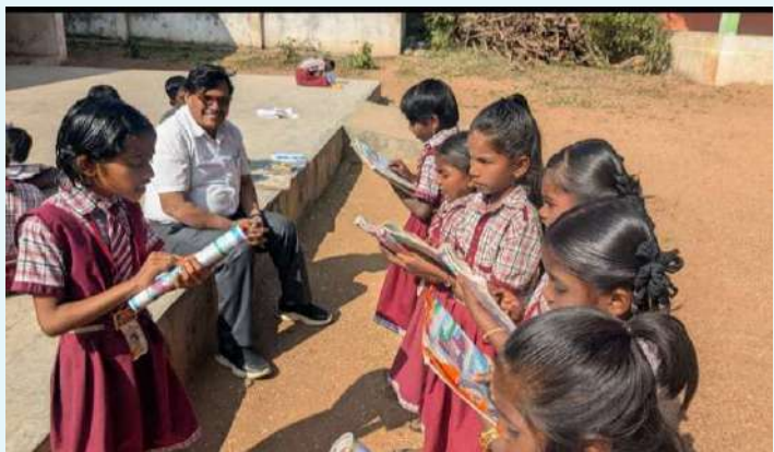
జగదేవపూర్: 06 జనవరి (ప్రజాజ్యోతి)

టీచర్లు బాగా చదువు చెబుతున్నారు. బాగా చదువు కోవాలమ్మ. చదువుతోనే భవిష్యత్ ఉంటుందమ్మా. మద్యాహ్న భోజనము మంచు గుంటుందమ్మా అంటూ జగదేవపూర్ కాంప్లెక్స్ ప్రధానోపాధ్యాయులు సైదులు విద్యార్థులతో ఆరా తీశారు. సోమవారం ఉదయం జగదేవపూర్ మండలంలో ధర్మారం, పీర్లపల్లి ప్రాథమిక పాఠశాలల ను సందర్శించారు. విద్యార్థులకు కొద్దిసేపు స్టడీ అవర్ నిర్వహించారు. విద్యాబోధన, మద్యాహ్న భోజనంపై ఆరా తీశారు. ఈ సందర్భంగా ఆయన మాట్లాడుతూ చదువు తోనే భవిష్యత్ ఉంటుందని, కన్నవాళ్ల కలలను సాకారం చేయాలని సూచించారు. కష్టపడి చదవడం కంటే ఇష్టపడి చదవాలని కోరారు. లక్ష్యంతో చదువుతే గమ్యం చేరడం పెద్దపని కాదన్నారు. చిన్నప్పటినుండే క్రమశిక్షణతో కూడిన విద్యాను అలవర్చుకోవాలని సూచించారు. ప్రభుత్వ పాఠశాలలో నాణ్యమైన విద్యా, భోజనం అందుతుందన్నారు.