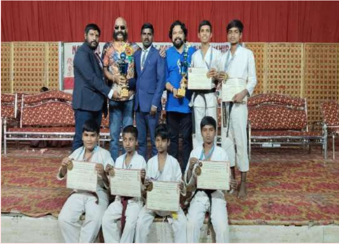
శివ్వంపేట ప్రజాజ్యోతి జనవరి 06:

-గోల్డ్ మెడల్ ప్రదానం చేసిన షోటో కాన్ సోర్ట్స్ అకాడమీ.