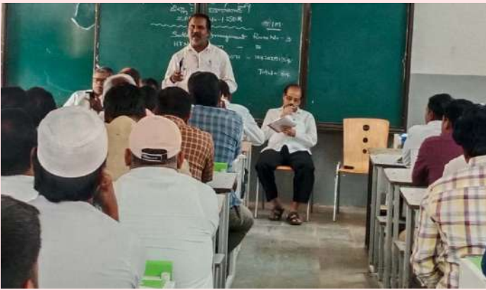
పరిగి, జనవరి 08 (ప్రజాజ్యోతి):

- ప్రధానోపాధ్యాయుల సమావేశంలో యంకూఓ గోపాల్