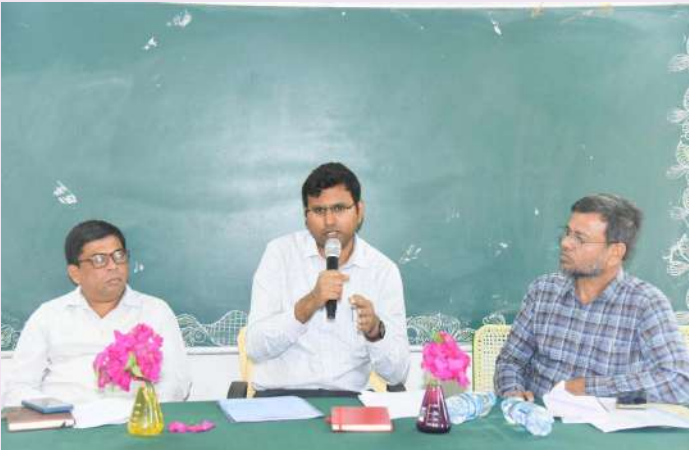
గద్యాల జనవరి 08 (ప్రజాజ్యోతి ప్రతినిధి):