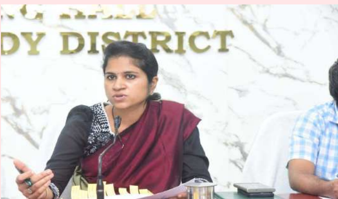
సంగారెడ్డి,జనవరి 08 , ప్రజా జ్యోతి న్యూస్ :-