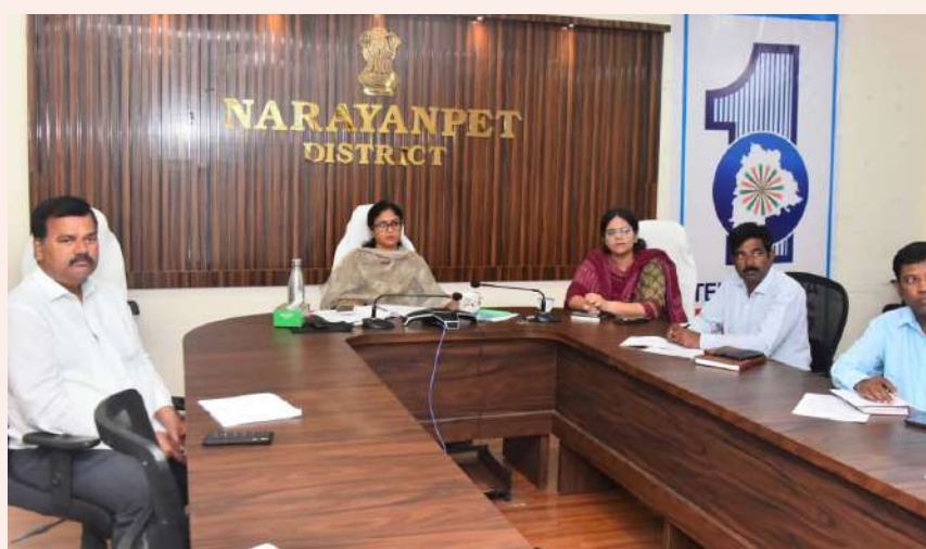
నారాయణపేట జిల్లా ప్రతినిధి ప్రజాజ్యోతి జనవరి08: