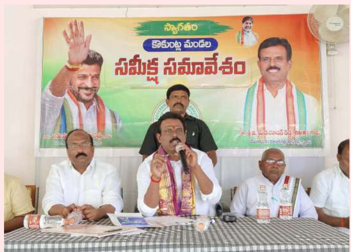
అడ్డాకుల, జనవరి 8 (ప్రజాజ్యోతి)

- అధికారులకు సూచించిన దేవరకర్ర ఎమ్మెల్యే