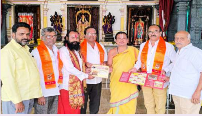
రాయపోల్ జనవరి 8 ప్రజా జ్యోతి