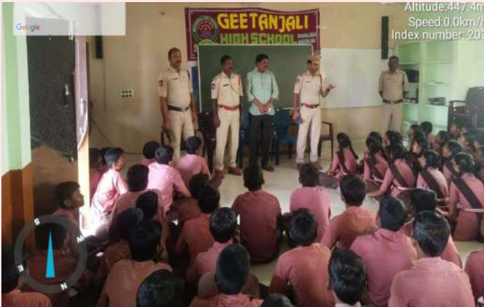
నారాయణపేట జిల్లా ప్రతినిధి ప్రజాజ్యోతి జనవరి08:

- మద్దూర్ గీతాంజలి హైస్కూల్లో విద్యార్థులకు సైబర్ నేరాల పట్ల అవగాహన