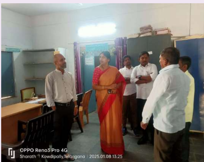
కొడిపల్లి ప్రజా జ్యోతి జనవరి 8