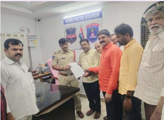
కూకట్ పల్లి, జనవరి 08 (ప్రజా జ్యోతి) :