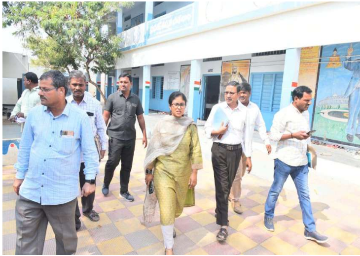
నారాయణపేట జిల్లా ప్రతినిధి ప్రజాజ్యోతి జనవరి08: