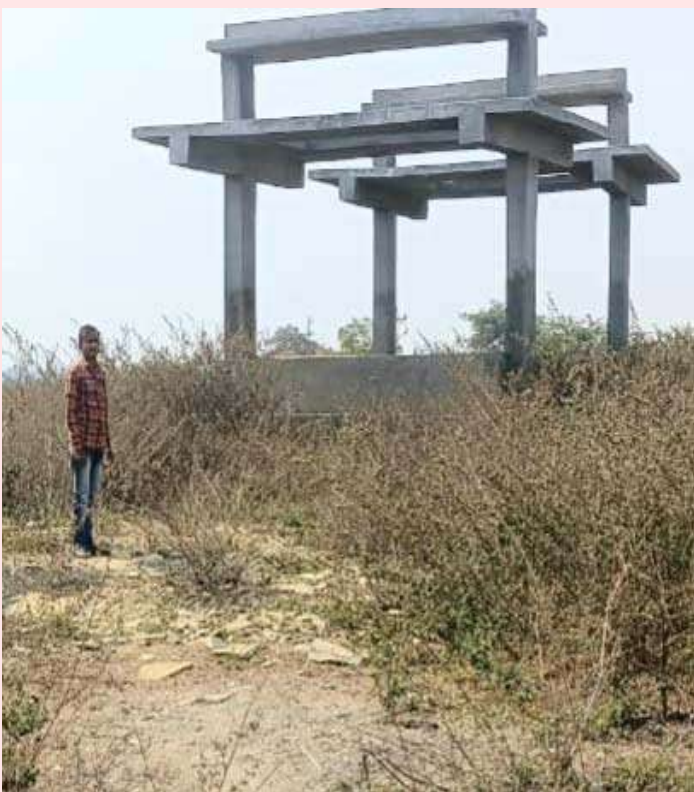
బషీరాబాద్ జనవరి 8 ప్రజా జ్యోతి