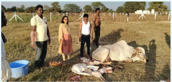
మోమిన్ పెట్ జనవరి 2 ప్రజా జ్యోతి

మోమిన్ పేట్ మండలం లోని కాపాడాలని ఎంతో ప్రయత్నం చేసినప్పటికీ కూడా లాగా తల్లి కడుపులో లేగ తల ఒడి తిరగడం వలన మరణించడం జరిగిందని ఆవేదన వ్యక్తం చేశారు. పరిధిలో ఫంక్షనహల్ పక్కన ఆవు పులి నొప్పులతో బాధపడుతున్నా ఆవును కాపాడడానికి మధ్యాహ్నం ఒంటిగంట నుండి నాలుగు గంటల వరకు ప్రయత్నం చేసి తల్లిని కాపాడారు. దూడ తల లోపాల వంకర వెళ్లడం వలన దూడ మరణించడం జరిగింది. ఆవు క్షేమంగానే ఉంది డాక్టర్ గీత తన సిబ్బందితో వెళ్లారు