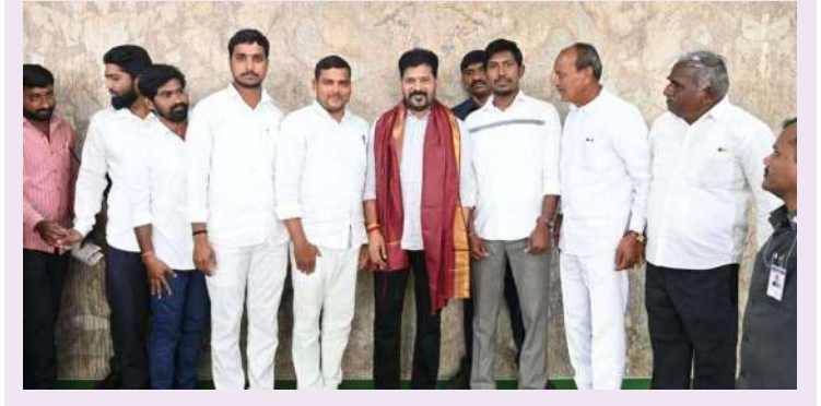
యాచారం, జనవరి 02 (ప్రజాజ్యోతి):

- తెలిపిన రాష్ట్ర ఒకేషనల్ టీచర్స్ అసోసియేషన్