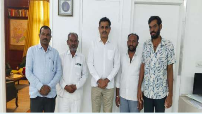
బషీరాబాద్ జనవరి 02 ప్రజా జ్యోతి