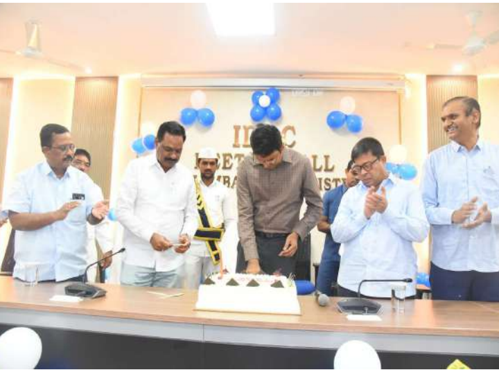
గద్వాల జనవరి 02 (ప్రజా జ్యోతి ప్రతినిధి):