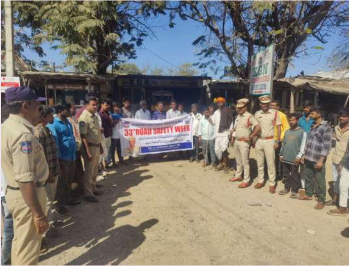
యాల్ జనవరి 25 ప్రజా జ్యోతి