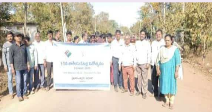
జహీరాబాద్, జనవరి 25 ( ప్రజా జ్యోతి న్యూస్ )

ఝాంసంగం మండల కేంద్రంలో జాతీయ ఓటర్ల దినోత్సవం- 2025ను రాష్ట్ర ప్రభుత్వం ఆదేశాల మేరకు ఇవాళ (శనివారం) ఘనంగా ర్యాలీ ద్వారా ఘనంగా నిర్వహించారు. ప్రతి ఏటా జనవరి 25న భారతదేశం జాతీయ ఓటర్ల దినోత్సవాన్ని జరుపుకుంటుంది. 1950లో భారత ఎన్నికల సంఘం (ఈసీఐ ) స్థాపించిన రోజును గుర్తు చేసుకుంటూ ప్రతి ఏటా వేడుకలు నిర్వహిస్తారు. ఎన్నికల్లో ఓటర్లను భాగస్వామ్యం చేసేందుకు, ఓటింగ్ ప్రాముఖ్యత తెలియజేసేందుకు 2011 నుంచి ఈ దినోత్సవాన్ని నిర్వహిస్తున్నారు. దేశ భవిష్యత్తు యువతపై ఆధారపడి ఉన్న నేపథ్యంలో వారిని ఓటింగ్ వైపు పోషించేలా నేడు పలు కార్యక్రమాలు నిర్వహించారు. ఈ కార్యక్రమంలో ఎంఆర్ఓ ఎంపీడీవో డిప్యూటీ ఎంఆర్ఓ ఆర్ఐఐ మరియు తదితరులు పాల్గొన్నారు.