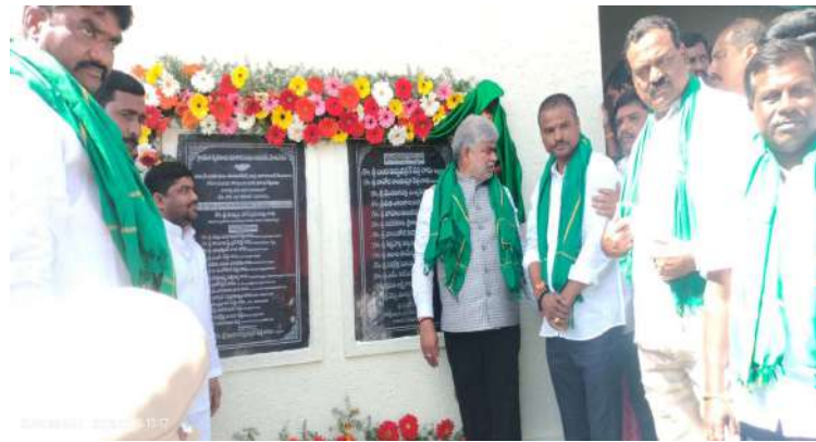
మోమిన్ పేట్ జనవరి 25 (ప్రజా జ్యోతి)