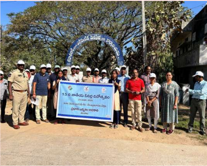
పటాన్ చెరు (ప్రజాజ్యోతి)