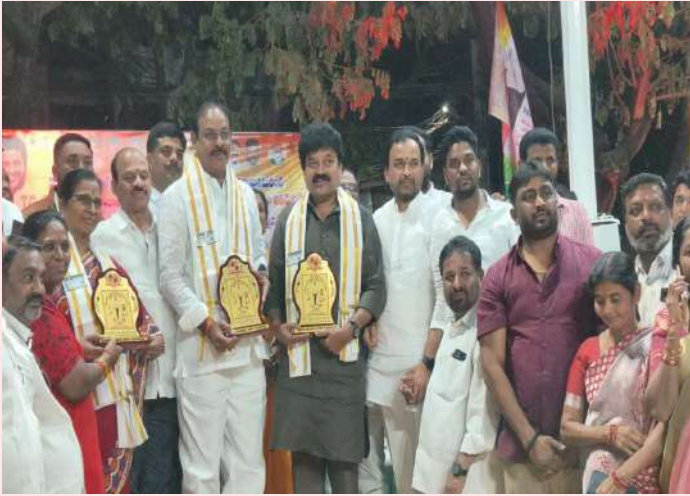
కూకట్ పల్లి, జనవరి 25 (ప్రజా జ్యోతి) :

-క్రీడలు మానసిక వికాసం తో పాటు శారీరక దారుణ్యాన్ని పెంపొందించేస్తుంది - హార్వర్డ్ రెడ్డి, బండి రమేష్