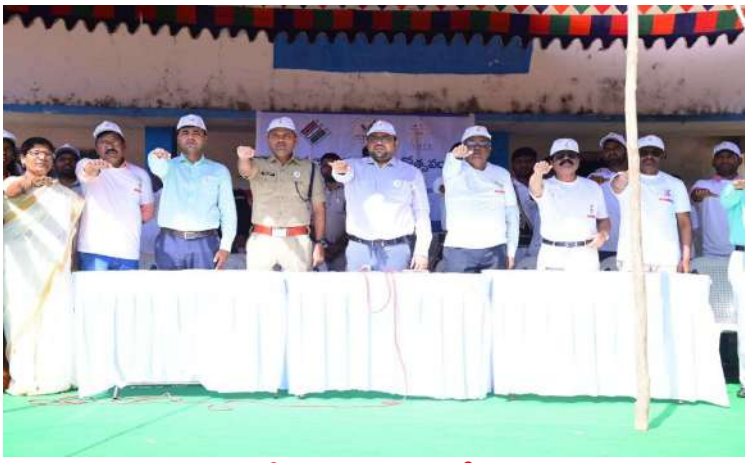
- ఘనంగా 15వ జాతీయ ఓటర్ల దినోత్సవం, ఓటును మించి ఏమి లేదు-నేను ఖచ్చితంగా ఓటు వేస్తాను - జిల్లా పరిషత్ మైదానంలో జిల్లా కలెక్టరేట్లోని సమావేశ మందిరంలో 15వ జాతీయ ఓటరు దినోత్సవం

నాగర్ కర్నూల్ జనవరి 25 (ప్రజా జ్యోతి ప్రతినిధి)