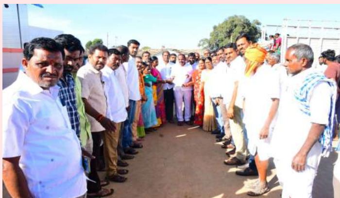
చేవెళ్ల జనవరి 25(ప్రజా జ్యోతి):