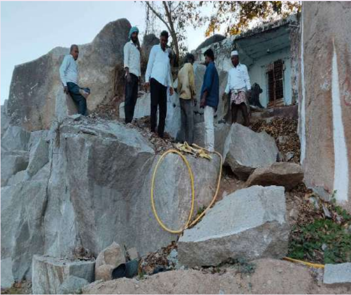
తొగుట జనవరి 25 (ప్రజా జ్యోతి):