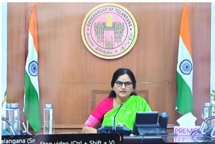
- అధికారులకు దిశా నిర్దేశం చేసిన కలెక్టర్