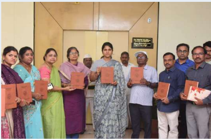
సంగారెడ్డి, జనవరి 25, ప్రజా జ్యోతి స్టూన్ ప్రతినిధి :-