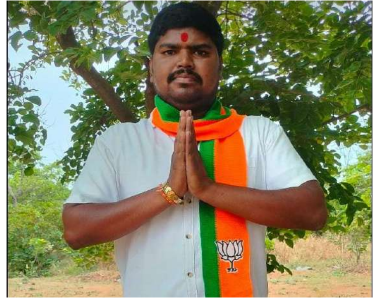
అరుదులైన పేద ప్రజలందరికీ అందాలని, ప్రతి నిరుపేద కుటుంబాలకు ప్రభుత్వ పథకాల ద్వారా లబ్ధి పొందేలా చేయాలని పేదలకు రాష్ట్ర ప్రభుత్వం, ఆర్డలందరికీ ప్రభుత్వ పథకాలు ఇవ్వాలని కోరారు.

తెలంగాణ రాష్ట్రంలో కాంగ్రెస్ ప్రభుత్వం ఏర్పడి 13 నెలలు అవుతుంది. 6 గ్యారంటీల కోసం, ప్రభుత్వం ఏర్పడిన నెల రోజుల్లోనే ఆరు గ్యారంటీల కోసం, దరఖాసులు చేసుకున్న పేద ప్రజలకు, ఏ ఒక్క పథకం కూడా అందలేదు, మహిళలకు మహాలక్ష్మి పథకం అనే ఎక్కడ పాయే, మహిళలకు ఎలక్ట్రిక్ స్కూటీ అన్నారు, పెళ్లి చేసుకున్న మహిళకు నగదుతో పాటు తులం బంగారం అనే ఎక్కడ పాయే పథకాలన్నీ వృద్ధులకు వికలాంగులకు పంచు ఇంకా కూడా రాలేవు, 4000 పంచు 6000 చేస్తామన్నారు, ఇన్ని పథకాలు ఇస్తామని కాంగ్రెస్ పార్టీ అధికారం లోకి వచ్చి ఏడాది అయిన పేద ప్రజలకి అందని పథకాలు, ఈ పథకాలు ఒక కళ గానే మిగిలిపోతున్నాయి, మళ్లీ జనవరిలో సర్పంచ్ ఎలక్షన్ అవుతాయని, అభ్యర్థులు వేచి చూస్తున్నారు, ఫిబ్రవరిలో అన్నారు, అవి కూడా అవుతాయో అవ్వయో, అయ్యో మయ్యో పరిస్థితిలో, జనాలు ఉన్నారు, ఇప్పటికైనా పెట్టిన దరఖాస్తులు, స్వీకరించి