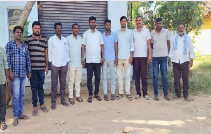
నంగునూరు (ప్రజా జ్యోతి)

- ప్రజాపాలనలో కాంగ్రెస్ నాయకుల రౌడీల రాజ్యం