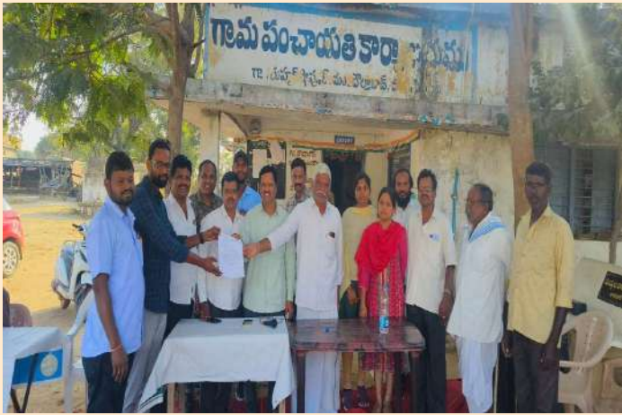
రాయపోల్/ దొల్తాబాద్ జనవరి 21 ప్రజా జ్యోతి :

ప్రజా ప్రభుత్వం ప్రతిష్టాత్మకంగా చేపట్టిన నాలుగు పథకాల అర్హుల కోసం ప్రజా పాలన సభలకు మండల వ్యాప్తంగా విస్తృతంగా దరఖాస్తులు వస్తున్నాయి. మంగళవారం మండల వ్యాప్తంగా పలు గ్రామాలలో తాసిల్దార్, ఎంపీడివో, వ్యవసాయ శాఖ, మొదలైన అధికారుల పర్యవేక్షణలో ఆయా గ్రామాలలో ప్రజల నుండి దరఖాస్తులను స్వీకరించారు. ఈ సందర్భంగా పలు గ్రామాలలో అధికారులు మాట్లాడుతూ అర్హులైన ప్రతి ఒక్కరూ దరఖాస్తు చేసుకోవాలని, సోషల్ మీడియాలో వచ్చే పుకార్లను నమ్మవద్దని అర్హులైన ప్రతి ఒక్కరికి ప్రభుత్వ సంక్షేమ పథకాలు అందే విధంగా దరఖాస్తుల ప్రక్రియ కొనసాగుతుందని ఈ సందర్భంగా వారు పిలుపునిచ్చారు. ప్రజలు ఎవరి మాటలు నమ్మి పైరవీకారులకు దబ్బులు ఇవ్వవద్దని కోరారు. అర్హతను బట్టి ప్రభుత్వ పథకాలకు ఎంపిక చేయడం జరుగుతుందని ఈ సందర్భంగా వారు తెలిపారు. ఈ కార్యక్రమం లో నాయకులు ప్రజా ప్రతినిధు గ్రామస్తులు పాల్గొన్నారు.