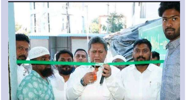
కల్వర్ 21. జనవరి.టప్రజా జ్యోతి

సంగారెడ్డి జిల్లాలోని నారాయణఖేడ్ పట్టణంలో ఎం.ఐ.ఎం.పార్టీ కార్యాలయాన్ని కార్యన్ ఎమ్మెల్యే కౌసర్ మొహియుద్దీన్ ప్రారంభించారు. ఈ సందర్భంగా ఎమ్మెల్యే మాట్లాడుతూ.. ఎంఐఎం పార్టీ బలోపేతానికి కృషి చేస్తున్న కార్యకర్తల పట్టుదల ఆమోఘమైనదని ప్రతి మండల కేంద్రం గ్రామంలో. బలహీన బడుగు వర్గాల. సన్న కారు. చిన్న కారు. రైతులకు.. వారి మంచి చెడులను గుర్తించి ముందుండి సాయం చేస్తున్న పార్టీ కార్యకర్తలకు అభినందించారు. తమ పార్టీ సెక్యూర్ పార్టీ సెక్యూలర్ పార్టీ. అందరికీ కలుపుకొని పనిచేస్తున్న పార్టీ అని తెలిపారు. నారాయణఖేడ్ ఎం.ఐ.ఎం.పార్టీ అధ్యక్షులు మోహీద్ పటేల్ ఎమ్మెల్యే కౌసర్ మొహియుద్దీన్కు పూలమాల వేసి శాలువాతో సత్కరించారు. ఈ కార్యక్రమంలో నారాయణఖేడ్ ఎంఐఎం నాయకులు పార్టీ అభిమాన కార్యకర్తలు. ప్రముఖ న్యాయ కోవిదులు పాల్గొన్నారు.