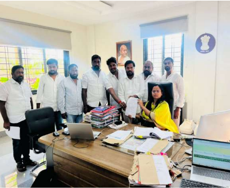
- జిల్లా కలెక్టర్ చేవెళ్ల ఎంపీకి వినతిపత్రం అందజేసిన గ్రామస్తులు