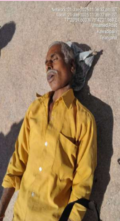
Network: 21-Jan-2025 11:36:32 am IST Local: 21-Jan-2025 11:36:32 am IST 17-20-59-503 N 78-42-1-969 E Unnamed Road Kavadiapally Telangana