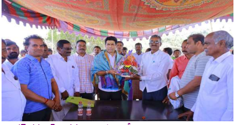
నాగర్ కర్నూల్, జనవరి 19 ప్రజా జ్యోతి

సుపరిపాలన అందించేందుకు నియోజకవర్గంలోని ప్రతి గ్రామంలో శిథిలావస్థలో ఉన్న పాత సచివాలయాలకు నూతన భవనాలు నిర్మించేందుకు ప్రభుత్వం కట్టుబడి ఉందని ఎమ్మెల్యే డాక్టర్.కూచుకుళ్ళ రాజేష్ రెడ్డి అన్నారు. ఆదివారం తాడూరు మండలంలోని నాగదేవుపల్లె గ్రామంలో నూతన గ్రామపంచాయతీ భవన నిర్మాణానికి ఎమ్మెల్యే డాక్టర్.కూచుకుళ్ళ రాజేష్ రెడ్డి ఆదివారం భూమి పూజ నిర్వహించారు. ఈ సందర్భంగా ఎమ్మెల్యే కూచుకుళ్ళ రాజేష్ రెడ్డి మాట్లాడుతూ కాంగ్రెస్ ప్రజాపాలనలో భాగంగా ముఖ్యమంత్రి రేవంత్ రెడ్డి ప్రజలకు పారదర్శక పాలన అందించేందుకుగాను ప్రతి గ్రామంలో సచివాలయ భవనం అవసరమని భావించి సచివాలయ భవనం లేని ప్రతి గ్రామాన్ని గుర్తించి నూతన భవనాలను త్వరత గతిన నిర్మాణం అయ్యేలా చూడాలని ఆదేశించారని అన్నారు. ఇందులో భాగంగానే ఈరోజు నాగదేవుపల్లె గ్రామంలో నూతన గ్రామ సచివాలయ భవనం నిర్మాణానికి పూజ