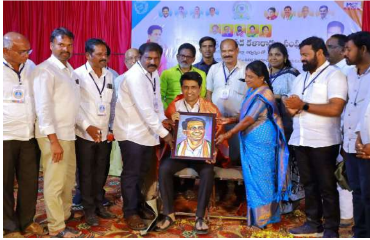
నాగర్ కర్నూలు, జనవరి 19 ప్రజా జ్యోతి