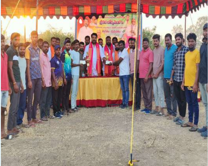
షాబాద్ జనవరి 19(ప్రజాజ్యోతి)