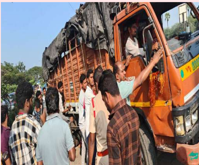
ఘట్టేసర్, జనవరి 19 (ప్రజా జ్యోతి) :

మేడ్చల్ జిల్లా ఘట్టేసర్ వరంగల్ హైవేపై ఆదివారం ఘోర రోడ్డు ప్రమాదం జరిగింది. యాత్రికులతో యాదగిరిగుట్ట వెళ్లి వస్తున్న డీసీఎం వ్యాన్ బోల్తా పడిన ఘటనలో 35 మందికి తీవ్ర గాయాలయ్యాయి అందులో ఇద్దరి పరిస్థితి విషమంగా ఉందని సమాచారం. పోలీసులు తెలిపిన వివరాల ప్రకారం మహబూబ్ నగర్ ఉప్పునూతల గ్రామానికి చెందిన 35 మంది శనివారం యాదగిరిగుట్టకి వెళ్లి తిరిగి ఆదివారం వస్తుండగా ఘట్టేసర్ వద్ద బ్రేకులు ఫెయిల్ అయ్యి గట్టు మైసమ్మ జాతర సందర్భంగా పార్క్ చేసి ఉన్న 20 కి పైగా ద్విచక్ర వాహనాలను ఢీకొట్టి ఒక్కసారిగా డీసీఎం వాహనం పట్టి కొట్టి బోల్తా పడిందని, సమాచారం అందుకున్న పోలీసులు ఘటన స్థలానికి చేసారుకోని క్షేతగాత్రులను ఘట్టేసర్ ఏరియా ఆసుపత్రికి చికిత్స కోసం తరలించారు.