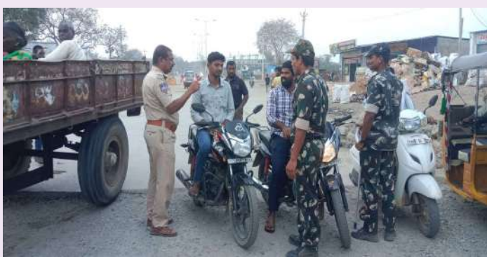
నారాయణపేట జిల్లా ప్రతినిధి ప్రజాజ్యోతి జనవరి18: