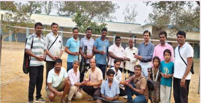
కొడిపల్లి ప్రజా జ్యోతి జనవరి 18