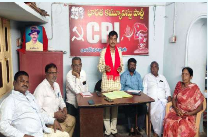
నాగర్ కర్నూల్(టాన్)జనవరి 18 ప్రజా జ్యోతి

-అమిత్ షాను మంత్రి పదవి నుండి తొలగించాలి