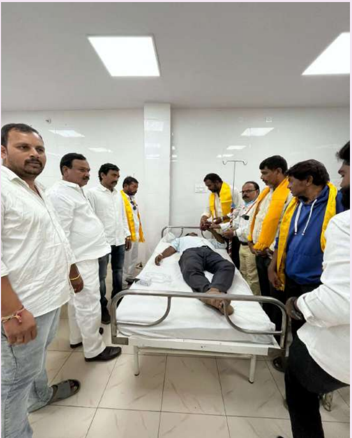
ఎల్వీనగర్ ప్రజా జ్యోతి ప్రతినిధి