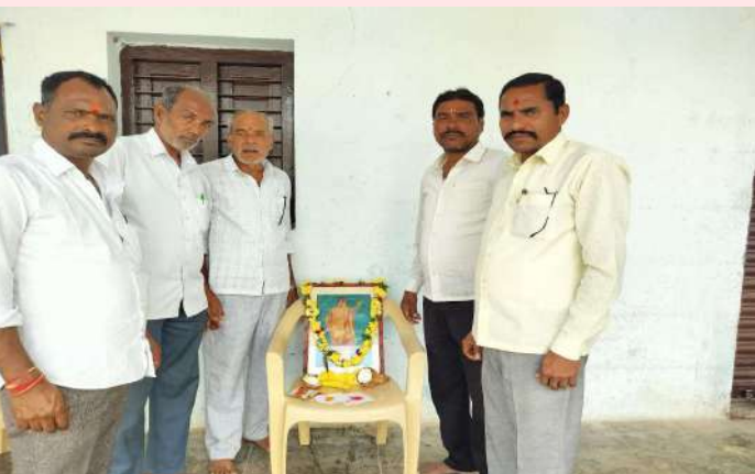
రాయపోల్/ దౌల్తాబాద్ జనవరి 18 ప్రజా జ్యోతి: