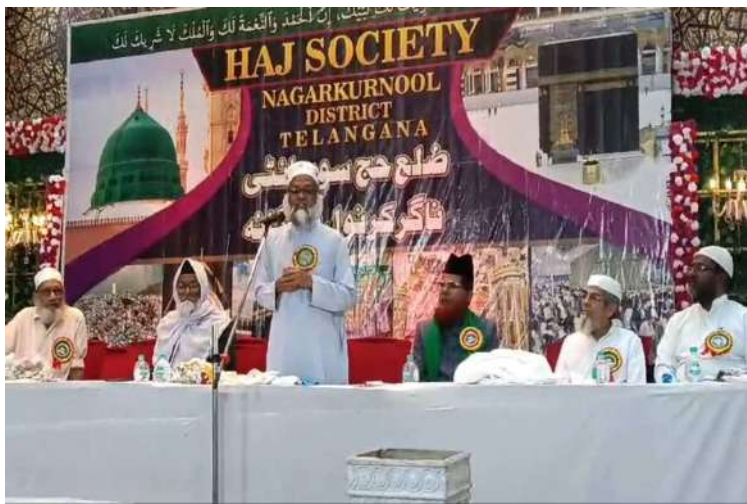
-హజ్ యాత్ర ఎంతో పవిత్రమైనది