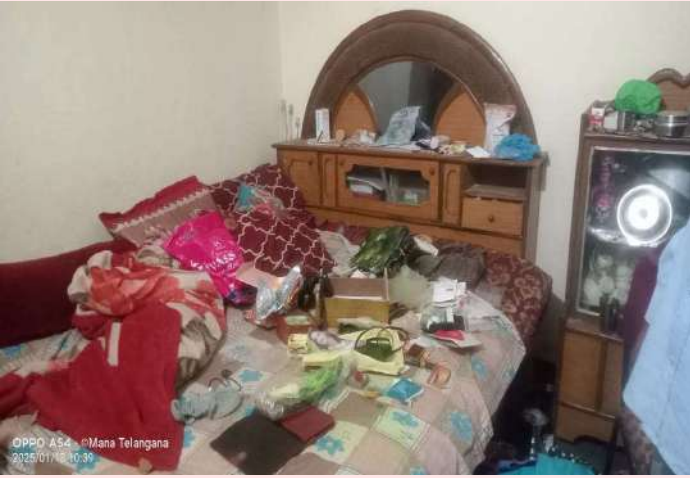
కొడిపల్లి ప్రజా జ్యోతి జనవరి 18