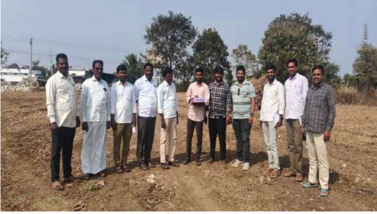
కొడంగల్ జనవరి 18 ప్రజా జ్యోతి స్టూన్:

తెలంగాణ రాష్ట్ర ప్రభుత్వం ప్రతిష్టాత్మకంగా అమలు చేయబోయే రైతు భరోసా పథకం సర్వేను క్షేత్రస్థాయిలో పరిశీలన చేపట్టిన రెవెన్యూ మరియు వ్యవసాయ శాఖ అధికారులు. శనివారం కొడంగల్ మండలం చిట్లపల్లి, రుద్రారం తదితర గ్రామంలో రైతు భరోసా పథకం భాగంలో వ్యవసాయేతర భూములను పరిశీలన చేపట్టారు. ప్లాట్లు, వ్యవసాయ యోగ్యం లో లేకుండా ఉన్న భూములు, వెంచర్లు చేసిన భూములు, తదితర వాటిని రెవెన్యూ మరియు వ్యవసాయ శాఖ అధికారులతో కలిసి పరిశీలించడం జరుగుతోందని, నిజమైన రైతుకు,