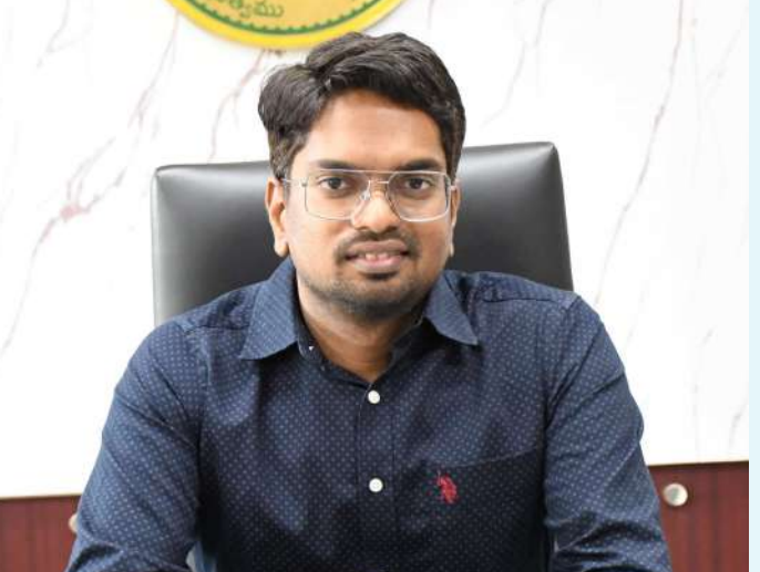
వనపర్తి, జనవరి 18 (ప్రజా జ్యోతి):

జిల్లాలో అర్జున వారందరికీ రేషన్ కార్డులు జారీ చేసేందుకు ప్రభుత్వం కట్టుబడి ఉందని జిల్లా కలెక్టర్ ఆదర్స్ సురభి నేడొక ప్రకటనలో తెలిపారు. ప్రజలు కొత్త రేషన్ కార్డుల కొరకు మండలంలోని ప్రజాపాలన సేవా కేంద్రాల దగ్గర దరఖాస్తు చేసుకోవచ్చని కలెక్టర్ స్పష్టం చేశారు. జిల్లాలో అర్జున వారందరికీ రేషన్ కార్డులు జారీ చేసేందుకు ప్రభుత్వం కట్టుబడి ఉందని, ప్రజలు ఎలాంటి ఆందోళన చెందాల్సిన అవసరం లేదని విజ్ఞప్తి చేశారు. జిల్లాలో ఈ నెల 21వ తేదీ నుంచి 24వ తేదీ వరకు జరగనున్న గ్రామ సభల్లో కూడా కొత్త రేషన్ కార్డుల కొరకు దరఖాస్తు చేసుకోవచ్చని చెప్పారు. అదేవిధంగా రేషన్ కార్డుల్లో కొత్త కుటుంబ సభ్యుల నమోదు కొరకు కూడా గ్రామ సభల్లో దరఖాస్తు చేసుకోవచ్చని కలెక్టర్ తెలిపారు.