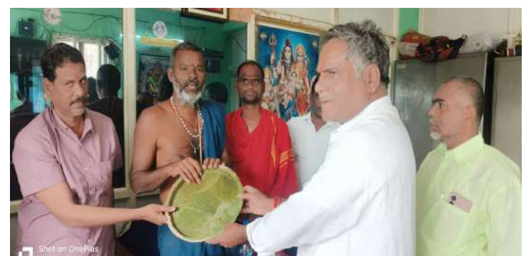
కుత్బుల్లాపూర్ జనవరి 16(ప్రజా జ్యోతి )