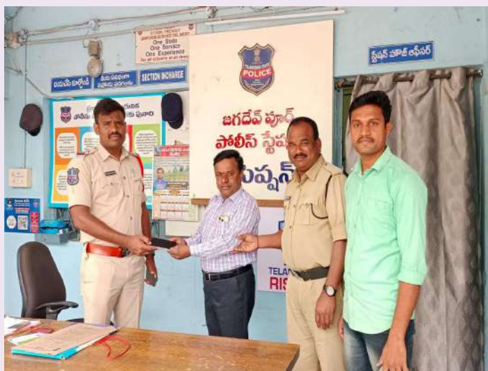
జగదేవపూర్: జనవరి 16 (ప్రజాజ్యోతి)

- ఫోన్ పోతే డోంట్ వర్రీ అంటున్న జగదేవపూర్ పోలీసులు