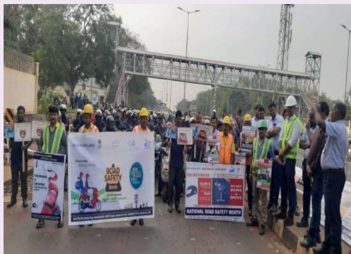
జిహీరాబాద్, జనవరి 16 ( ప్రజా జ్యోతి న్యూస్ )

సంగారెడ్డి జిల్లా జిహీరాబాద్ పట్టణం 65వ నెంబర్ జాతీయ రహదారి పక్కన మహింద్రా అండ్ మహింద్రా ప్యాక్టరీ వద్ద గురువారం సాయంత్రం 36వ జాతీయ రోడ్డు భద్రత మసోత్సవా బాగంగా దెక్కన్ టోల్ ప్లాజా సిబ్బంది మహింద్రా అండ్ మహింద్రా ప్యాక్టరీ సిబ్బందికి రోడ్డు భద్రత అవగాహన కల్పించారు. కరపత్రాలు ఇస్తూ ప్రతి ఒక్కరూ ద్విచక్ర వాహన దారులు హెల్మెట్ ధరించి వాహనాలను నడపాలని చూపించారు. వాహనలు జాతీయ రహదారి పై ఎలాంటి ప్రమాదలు, వాహనాల మరమ్మతులు ఉంటే ఎన్ఎఫ్ఎఫ్ఎఫ్ హెల్ప్ లైన్ నెంబర్ 1033 కాల్ చేసి వారి సహాయం పొందవచ్చు అని చూపించారు. ఈ కార్యక్రమంలో డెక్కన్ టోల్ ప్లాజా సిబ్బంది మరియు మహింద్రా అండ్ మహింద్రా ప్యాక్టరీ సిబ్బంది పాల్గొన్నారు.