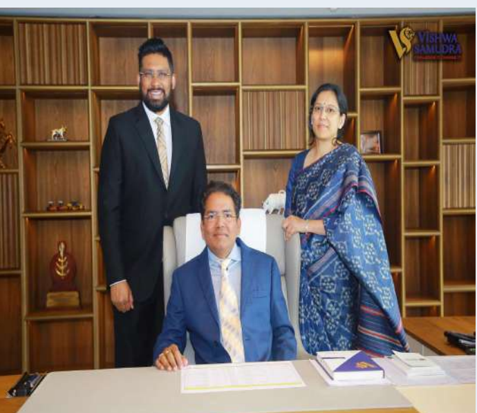
ముషీరాబాద్, జనవరి 16 (ప్రజా జ్యోతి) :