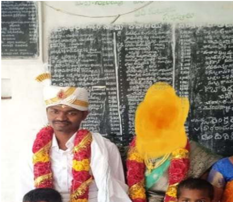
పై కేసు నమోదు చేసిన కరన్ కోట్ పోలీసులు విచారణ చేపట్టామని చెప్పారు.