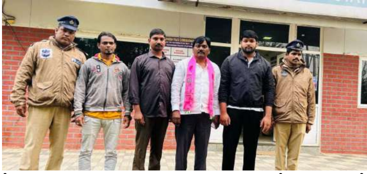
తీవ్రంగా ఖండిస్తున్నామన్నారు. కాంగ్రెస్ ప్రభుత్వంలో నిరసన తెలిపే స్వేచ్ఛ లేదన్నారు. కాంగ్రెస్ నాయకులు హుందాతనాన్ని కలిగి ఉండాలని దాడులకు పాల్పడిన వారిని వెంటనే అరెస్టు చేసి కఠిన చర్యలు తీసుకోవాలన్నారు.