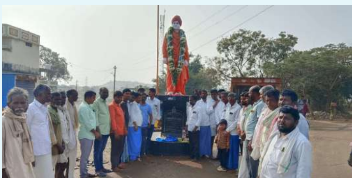
నారాయణపేట జిల్లా ప్రతినిధి ప్రజాజ్యోతి జనవరి12:

నారాయణపేట జిల్లా మద్దూర్ మండలంలోని పెదిరిపాడ్ గ్రామంలో స్వామి వివేకానంద జయంతి వేడుకలు ఘనంగా జరుపుకున్నారు. భారతదేశ యువతకు స్ఫూర్తి దాయకుడైన వివేకానంద గారి ఆదర్శాలను గుర్తు చేసుకుంటూ పలు కార్యక్రమాలు నిర్వహించారు. స్వామి వివేకానంద చిత్రపటానికి పూల మాలలు వేసి నివాళులర్పించడం ద్వారా ఆయన జీవితం మరియు బోధనలకు గౌరవం తెలిపారు. యువతను ఉద్దేశించి సదస్సులు నిర్వహించి, ఆయన ఆదర్శాలను ప్రచారం చేశారు. వివేకానంద గారి జీవితం ఆధారంగా నాటకాలు, కవితలు మరియు ఇతర సాంస్కృతిక కార్యక్రమాలు నిర్వహించారు. ఈ వేడుకల ద్వారా యువత తమలోని శక్తిని గుర్తించుకొని దేశ సేవకు కట్టుబడి ఉండాలని ప్రోత్సహించారు. ఈ కార్యక్రమంలో స్వామి వివేకానంద యాత్ కమిటీ మరియు గ్రామ ప్రజలు పాల్గొన్నారు.