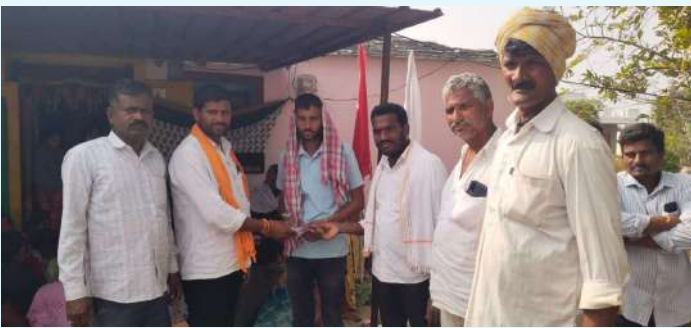
కోడంగల్ జనవరి 12 ప్రజా జ్యోతి స్యూస్: