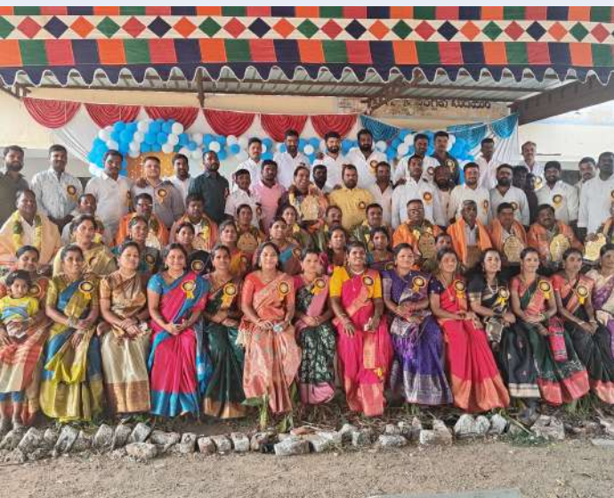
శంకర్ పల్లి జనవరి 12 (ప్రజా జ్యోతి) :

శంకర్ పల్లి మండలం, పర్వేద గ్రామంలోని జిల్లా పరిషత్ ఉన్నత పాఠశాలలో 2006-2007 పూర్వ విద్యార్థుల అపూర్వ కలయిక ఆదివారం జరిగింది. అప్పటి విద్యార్థులుగా ఉన్న వారు ఒకరికి ఒకరు పలకరించుకుంటూ శుభాకాంక్షలు తెలుపుకున్నారు. చదువుకునే రోజుల్లో పాఠశాలలో జరిగిన సంఘటనలను గుర్తు చేసుకుంటూ ఆనందం వ్యక్తం చేసుకున్నారు. ఆనాడు తమకు చదువులు చెప్పిన ఉపాధ్యాయులను ఘనంగా సన్మానించి వారికి జ్ఞాపికలను అందజేశారు. ఈ సందర్భంగా ఉపాధ్యాయులు మాట్లాడుతూ పదవ తరగతిలో చదువుకున్న తమ విద్యార్థులు మంచి ప్రయోజకులు అయ్యారని సంతోషాన్ని వ్యక్తం చేశారు. రానున్న రోజుల్లో కూడా ఇలాగే ఒకరినొకరు కలుసుకుంటూ ఆనందంగా జీవితాలను కొనసాగించాలని ఆకాంక్షించారు.